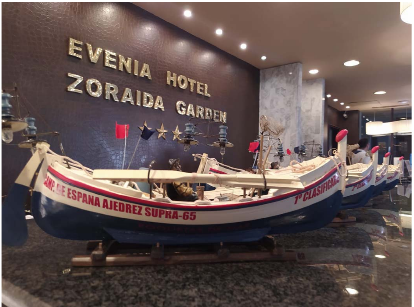
Hotel Evenia Zoraida Garden

Los campeonatos en ambas categorías se han disputado por sistema suizo a 9 rondas de 90 minutos por jugador para toda la partida más 30 segundos de incremento por movimiento.