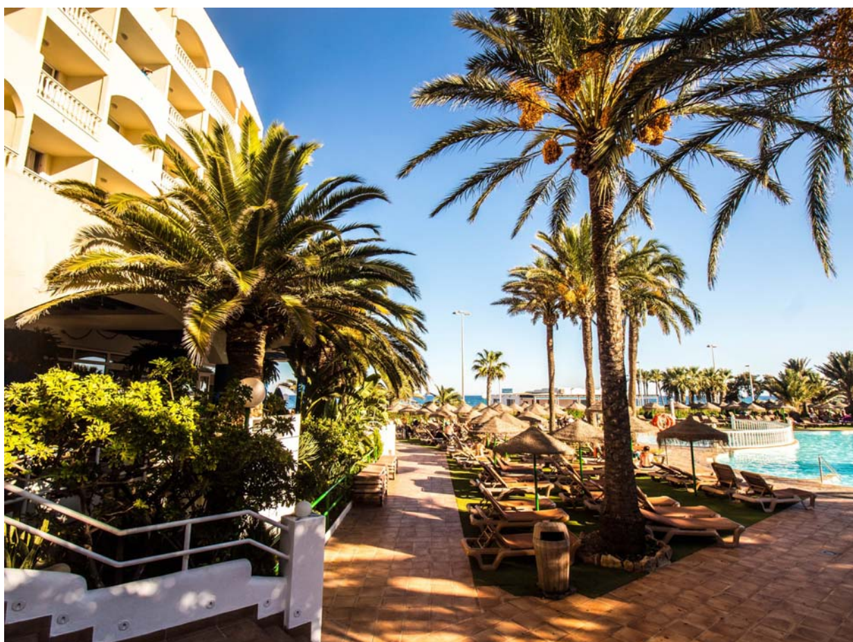
Aspecto exterior del hotel