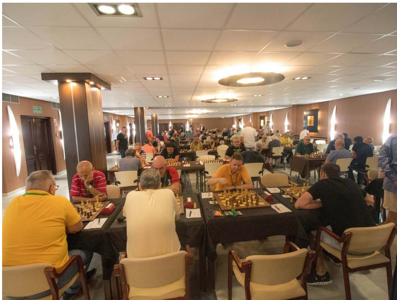
Sala de juego

Buena actuación de nuestro jugador en términos generales.