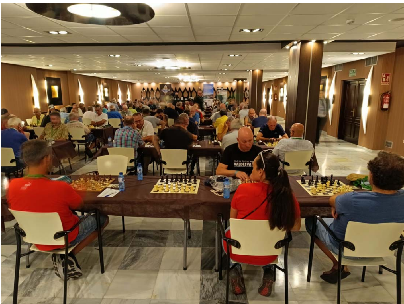
Sala de juego

Buena actuación de nuestros jugadores en términos generales.