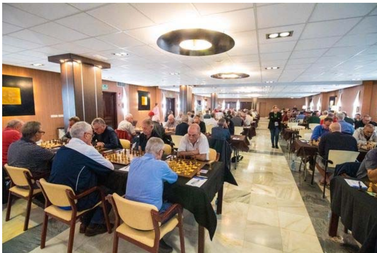
Sala de juego