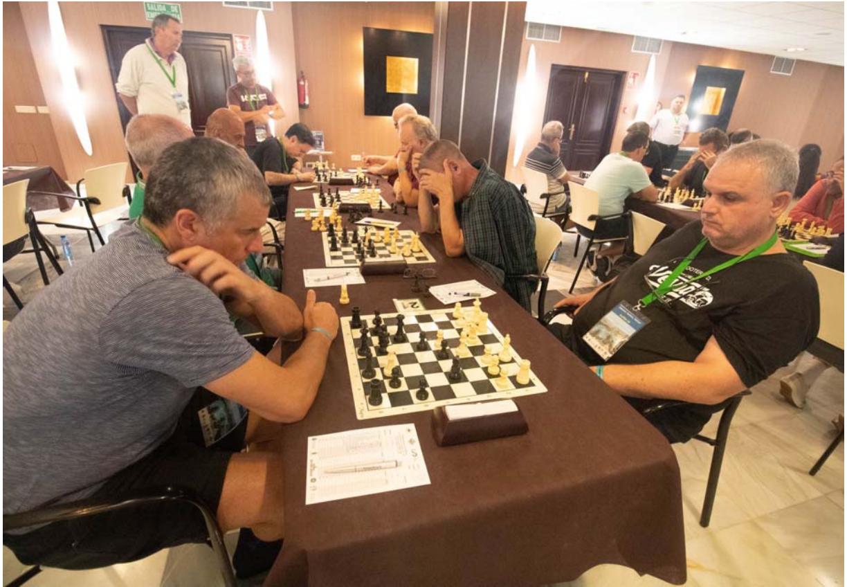
Durante la partida

C/. Alfonso XIII, 101-LOS DOLORES 30310- CARTAGENA (Murcia) Tel/Fax. 968 12 61 62 www.farm.es e-mail: farm@farm.es