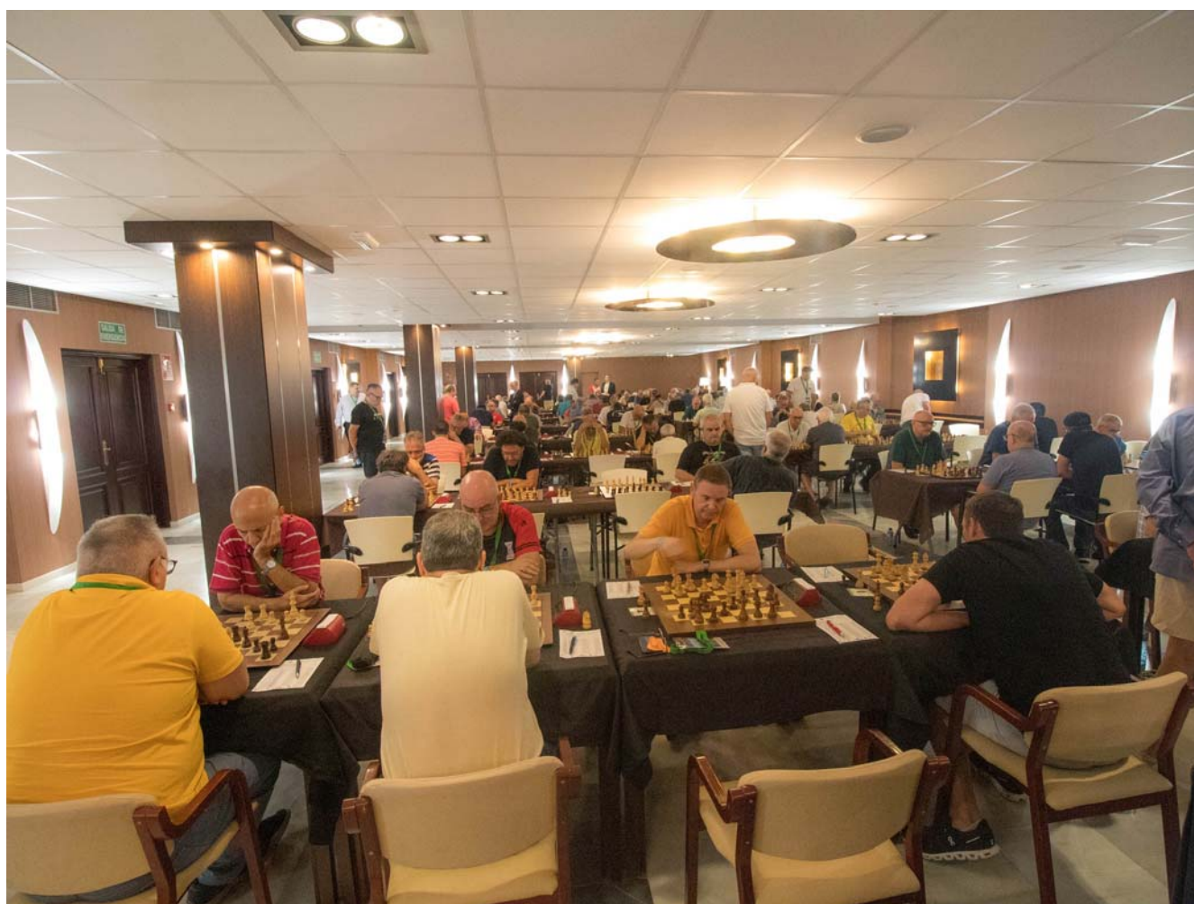
Sala de juego

Buena actuación de nuestros jugadores en términos generales.