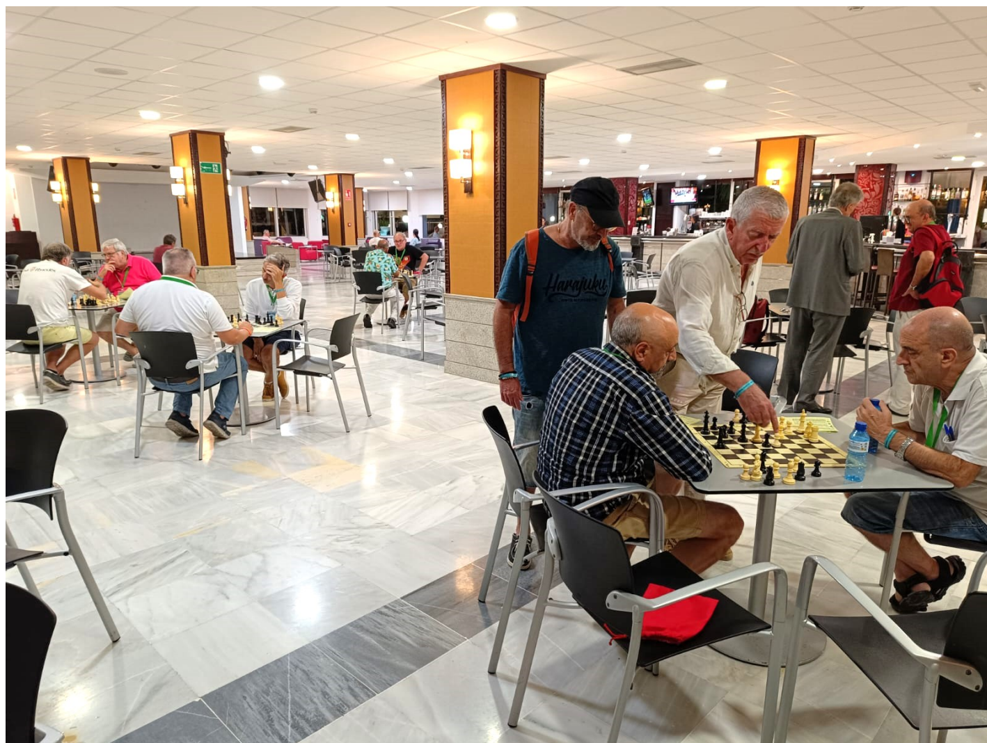
Sala de análisis

CE INDIVIDUAL VETERANOS M50 2023 - https://info64.org/ce-individual-veteranos-m50-2023