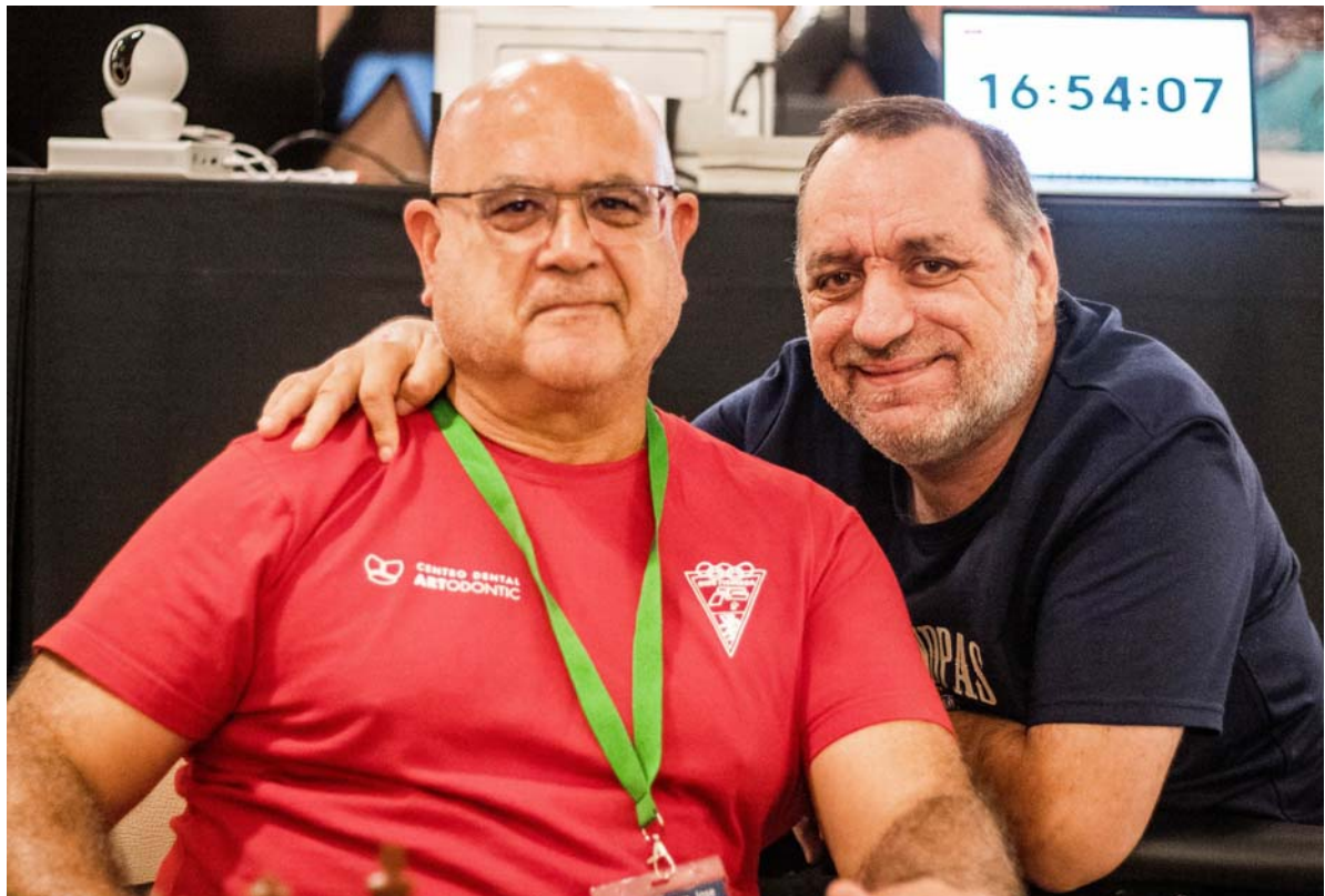
Jugadores y amigos