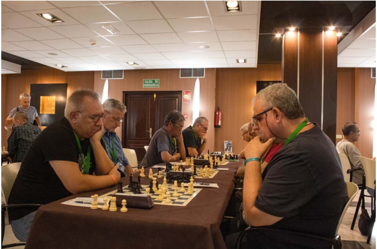
Durante la partida

C/. Alfonso XIII, 101-LOS DOLORES 30310- CARTAGENA (Murcia) Tel/Fax. 968 12 61 62 www.farm.es e-mail: farm@farm.es