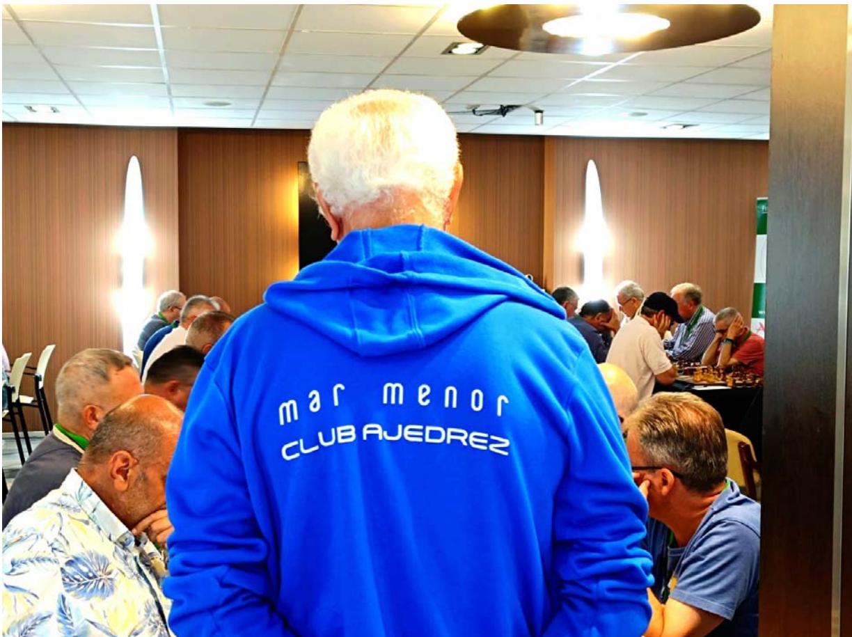
Jugador C.A Mar Menor