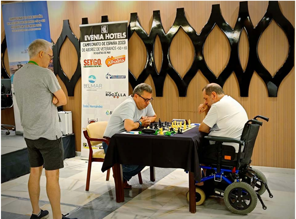
Durante la partida