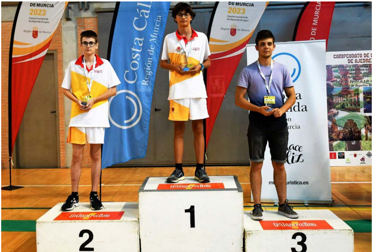
Podium vencedores Campeonato España ELO sub 1700

C/. Alfonso XIII, 101-LOS DOLORES 30310- CARTAGENA (Murcia) Tel/Fax. 968 12 61 62 www.farm.es e-mail: farm@farm.es