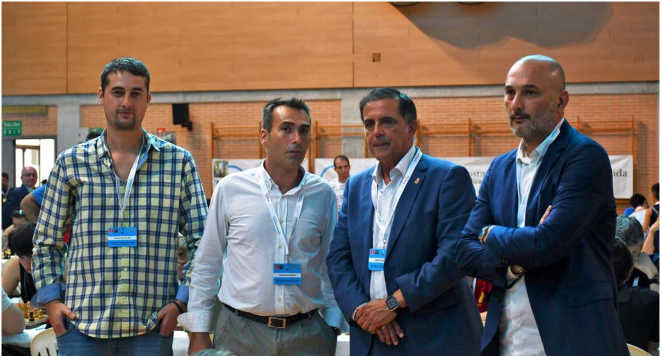
Autoridades y organizadores

C/. Alfonso XIII, 101-LOS DOLORES 30310- CARTAGENA (Murcia) Tel/Fax. 968 12 61 62 www.farm.es e-mail: farm@farm.es