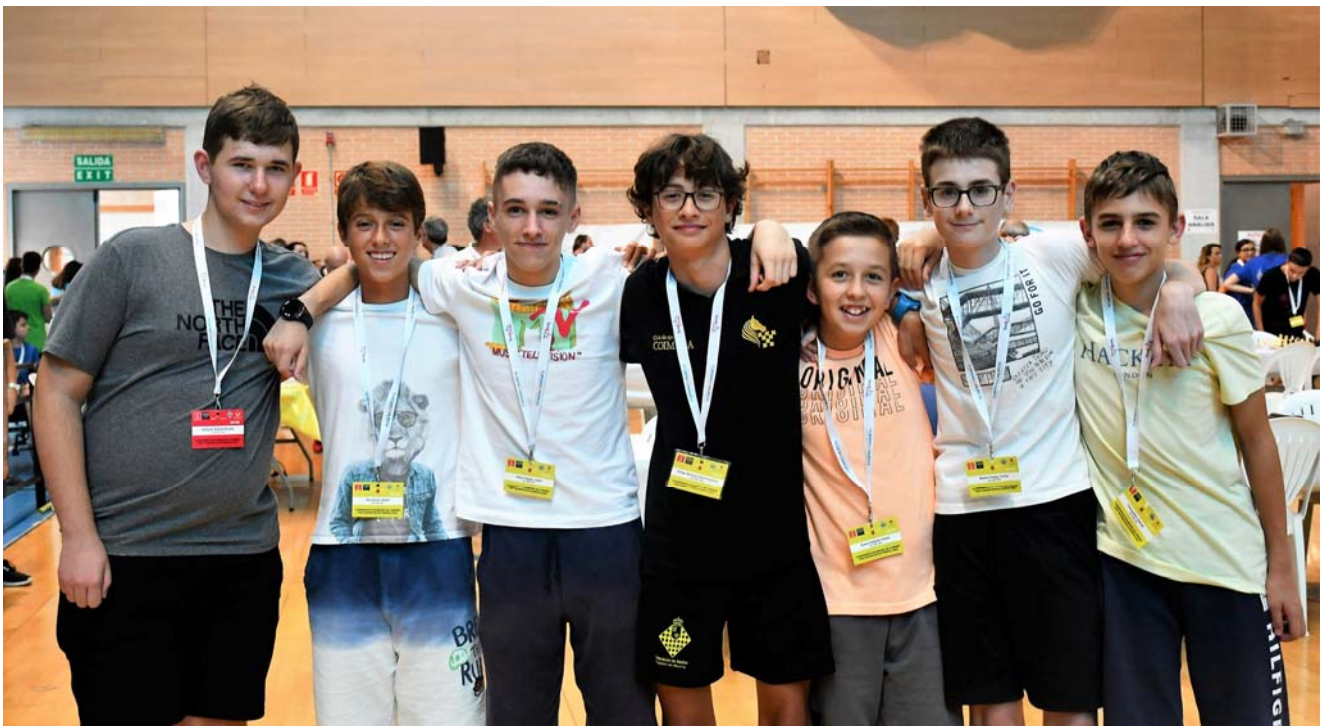
Algunos participantes F.A.R.M