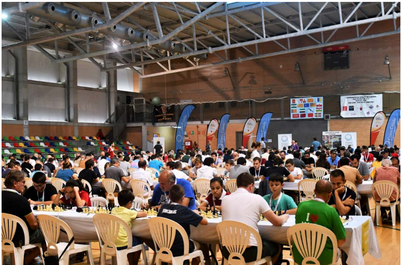
Sala de juego