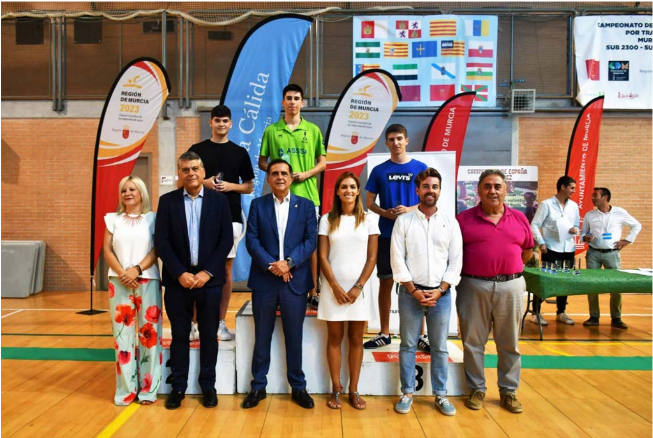
Premiados y autoridades Campeonato España ELO sub 2000

C/. Alfonso XIII, 101-LOS DOLORES 30310- CARTAGENA (Murcia) Tel/Fax. 968 12 61 62 www.farm.es e-mail: farm@farm.es