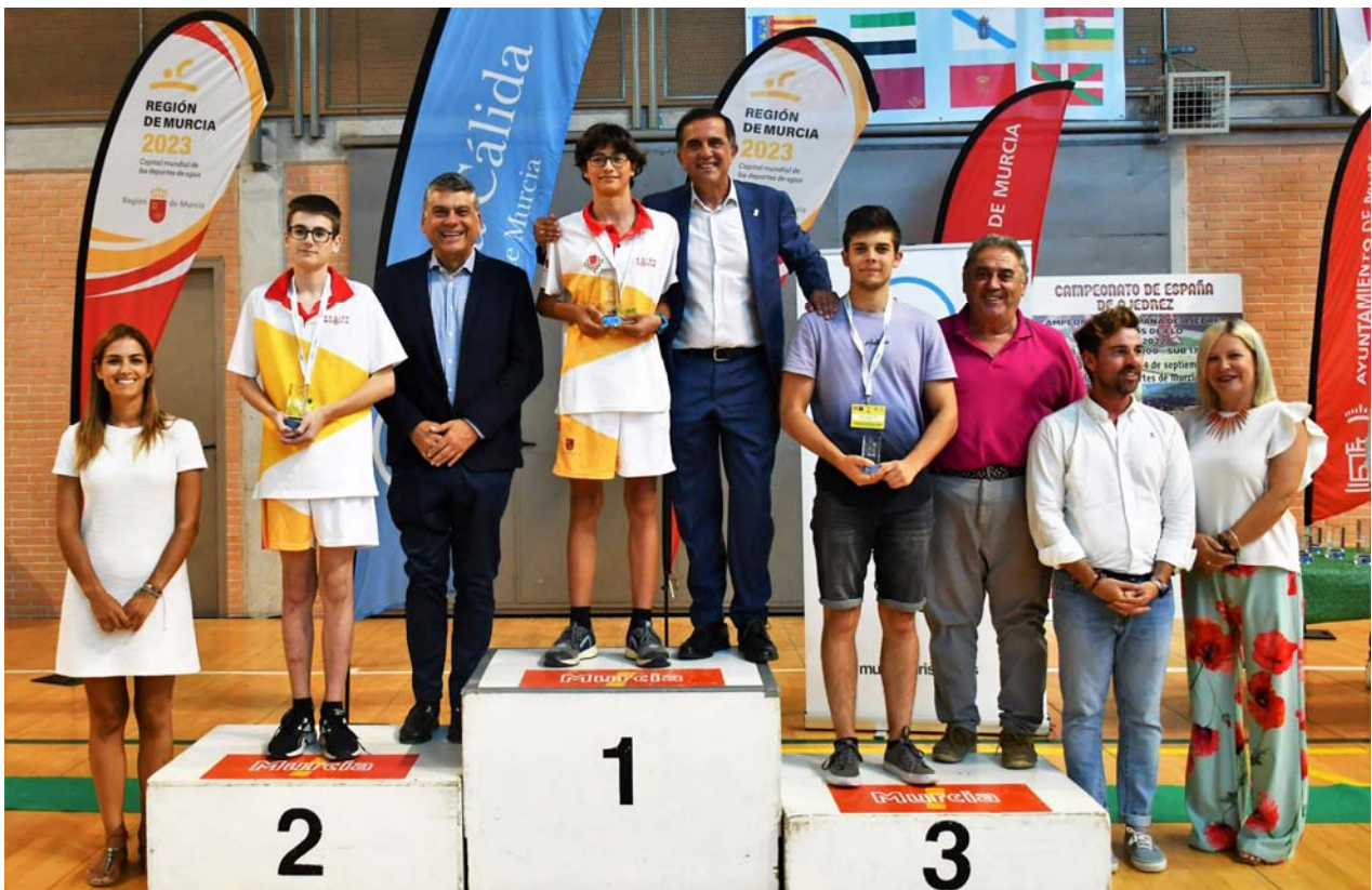
Premiados y autoridades Campeonato España ELO sub 1700