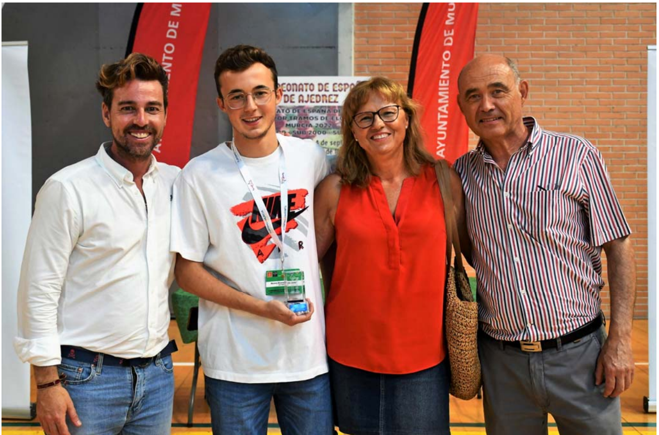
Familia Moreno con el Director General de Deportes