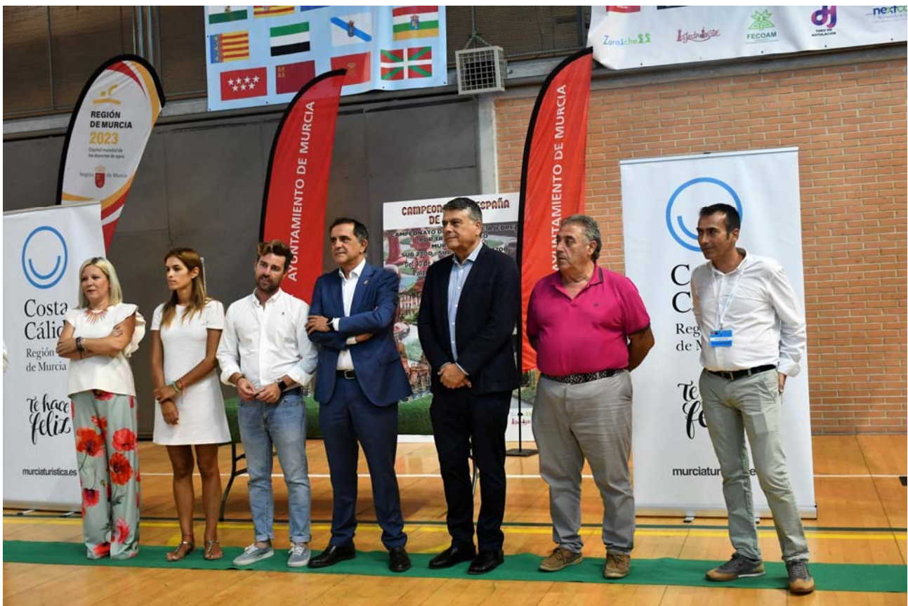
Autoridades entrega premios