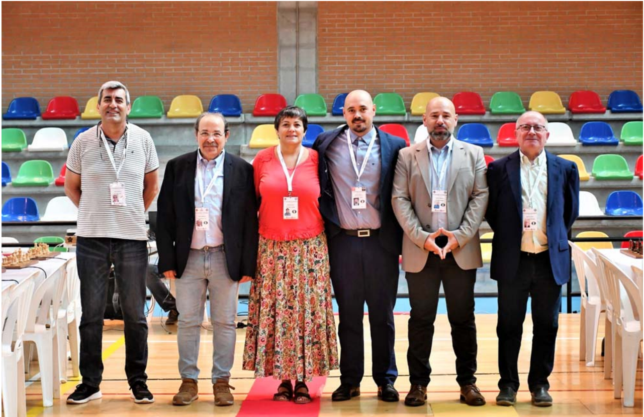
Equipo arbitral Campeonato España por tramos ELO

C/. Alfonso XIII, 101-LOS DOLORES 30310- CARTAGENA (Murcia) Tel/Fax. 968 12 61 62 www.farm.es e-mail: farm@farm.es