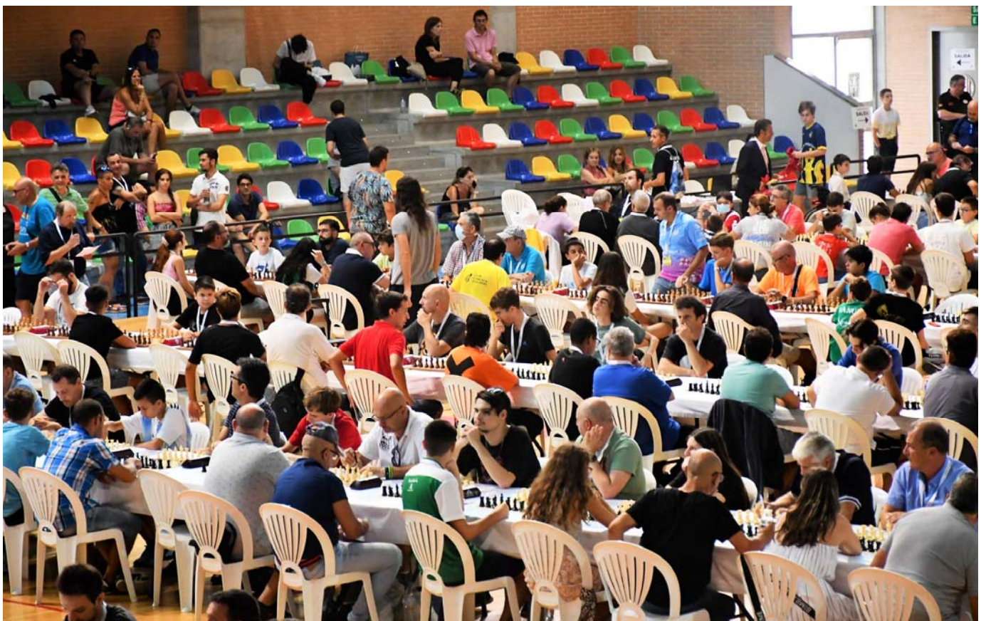
Sala de juego