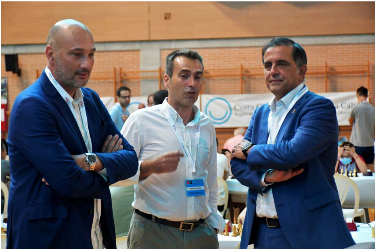
Sr. Alcalde y Concejal de Deportes de Murcia