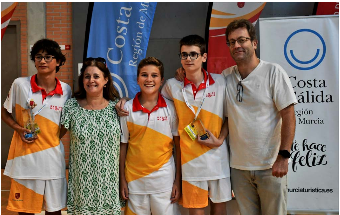
Jugadores y familiares