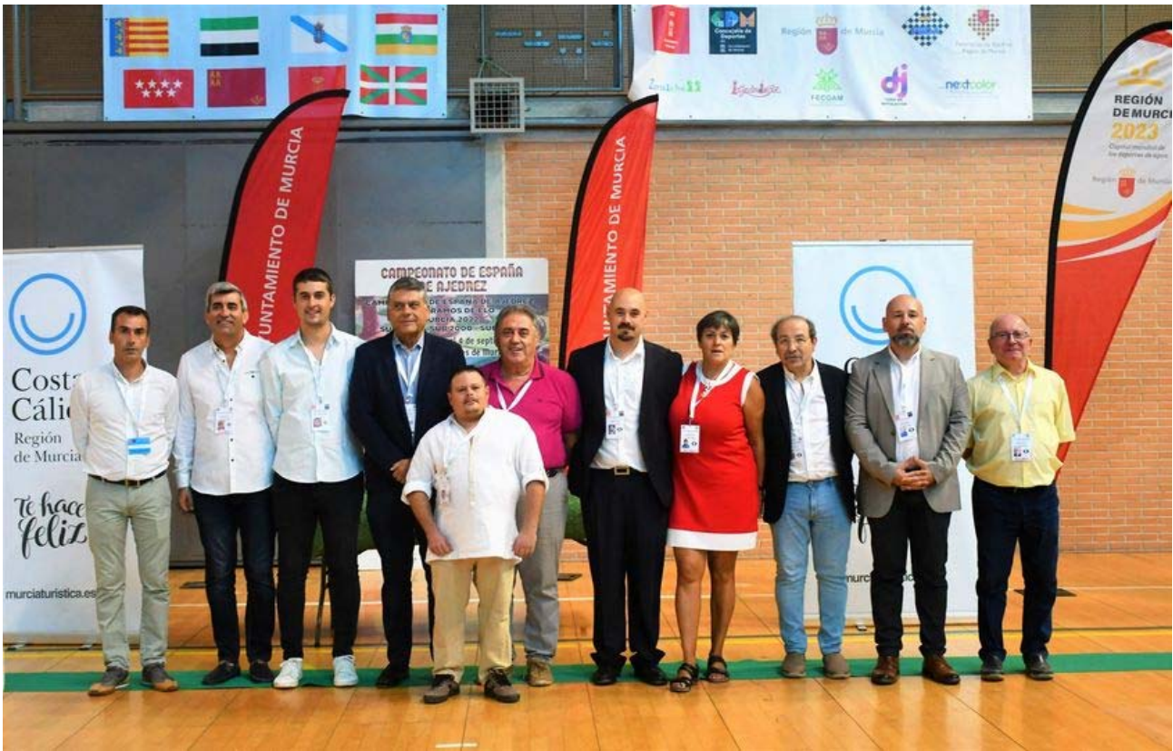
Equipo técnico y organización Campeonato España por tramos ELO

C/. Alfonso XIII, 101-LOS DOLORES 30310- CARTAGENA (Murcia) Tel/Fax. 968 12 61 62 www.farm.es e-mail: farm@farm.es