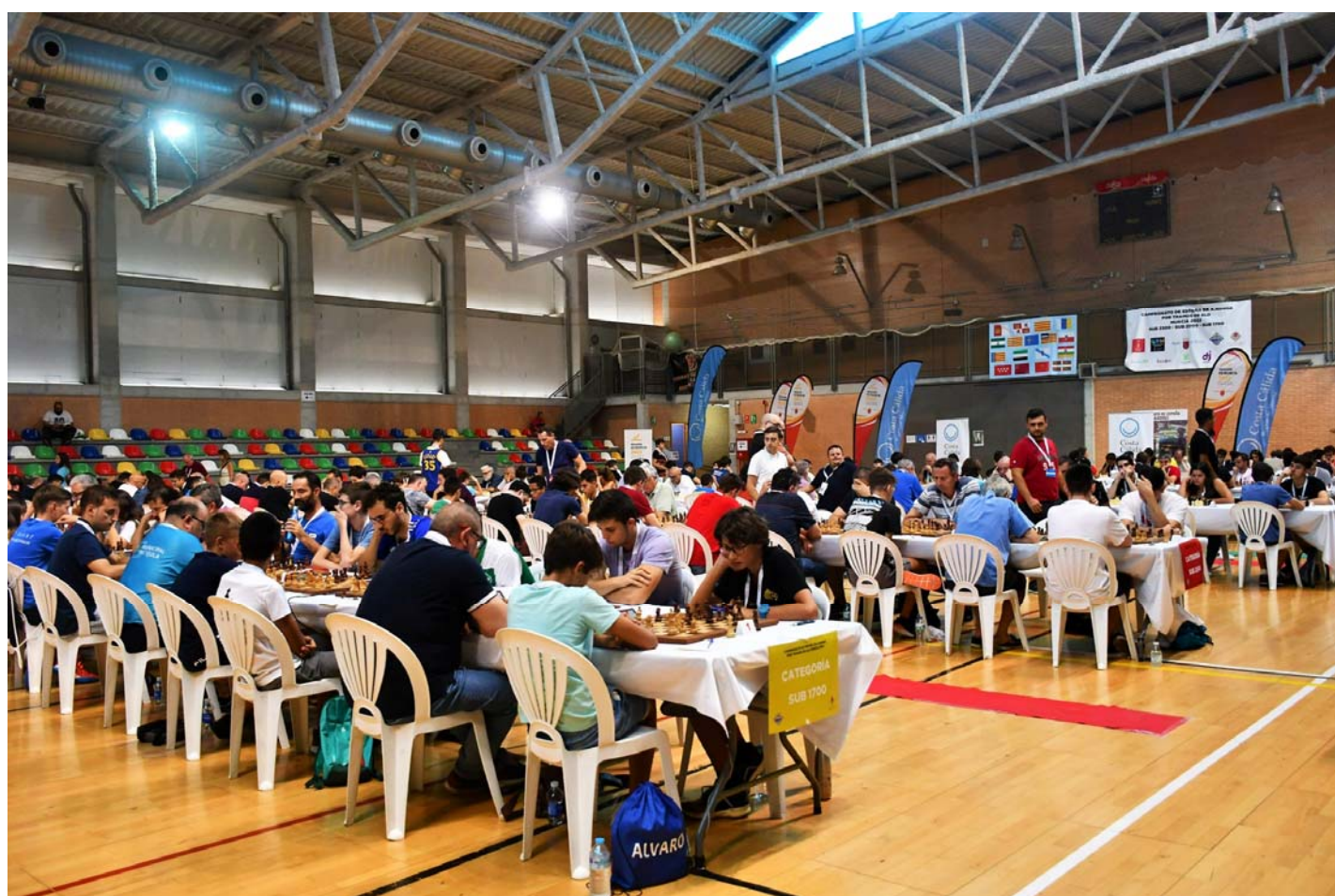
Sala de juego

Campeonato de Espana de aficionados 2022 Tramo 2000 - https://info64.org/campeonato-de-espana-de-aficionados-2022-tramo-2000-295529