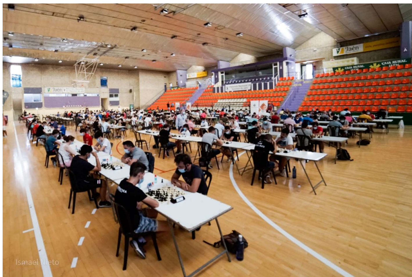
Sala de juego