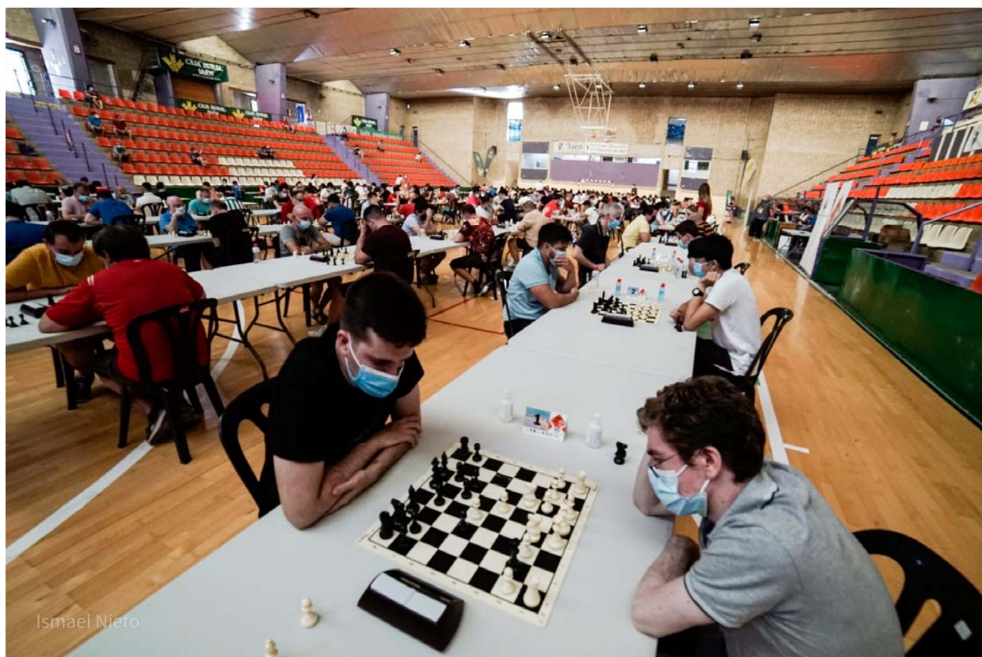
Sala de juego