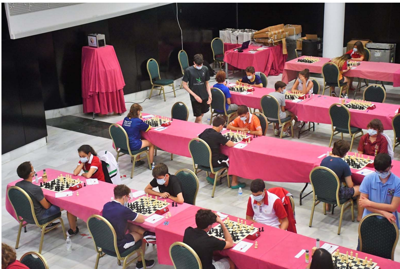
Aspecto sala de juego

Buena actuación de todos los participantes de nuestra Federación: