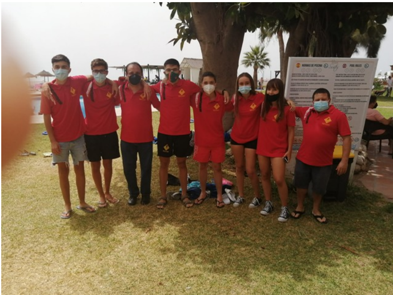
Participantes Federación Ajedrez Región de Murcia

Expedición Federación Ajedrez Región de Murcia