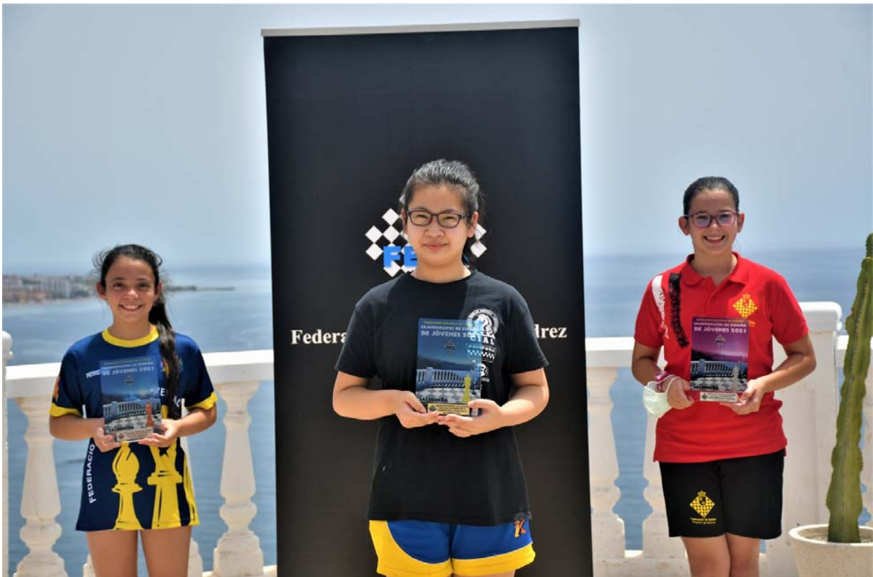
Premiadas sub 12