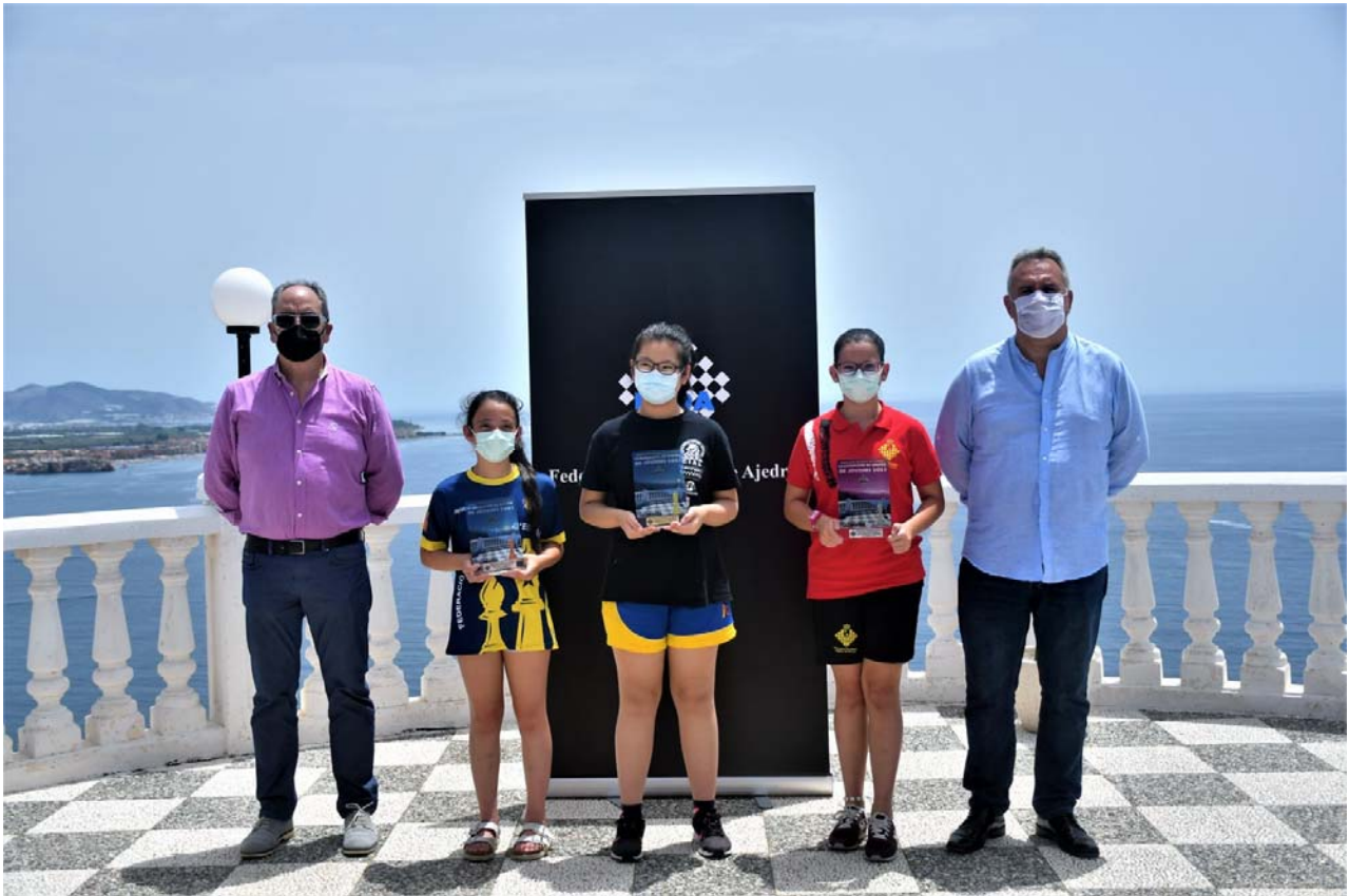
Premiadas sub 12 y autoridades

C/. Alfonso XIII, 101-LOS DOLORES 30310- CARTAGENA (Murcia) Tel/Fax. 968 12 61 62 www.farm.es e-mail: farm@farm.es