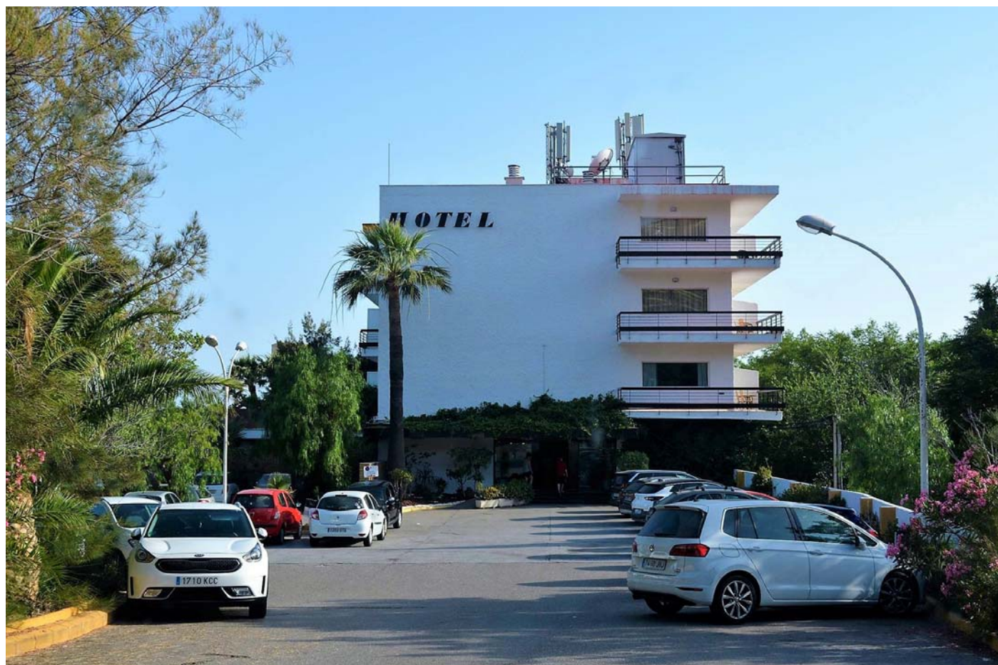
Entrada al hotel