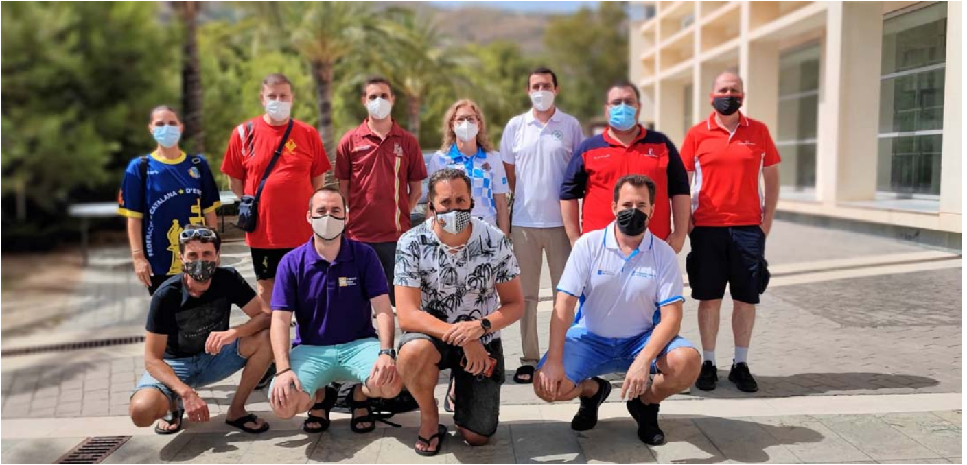
Delegados Federaciones Autónomas

C/. Alfonso XIII, 101-LOS DOLORES 30310- CARTAGENA (Murcia) Tel/Fax. 968 12 61 62 www.farm.es e-mail: farm@farm.es