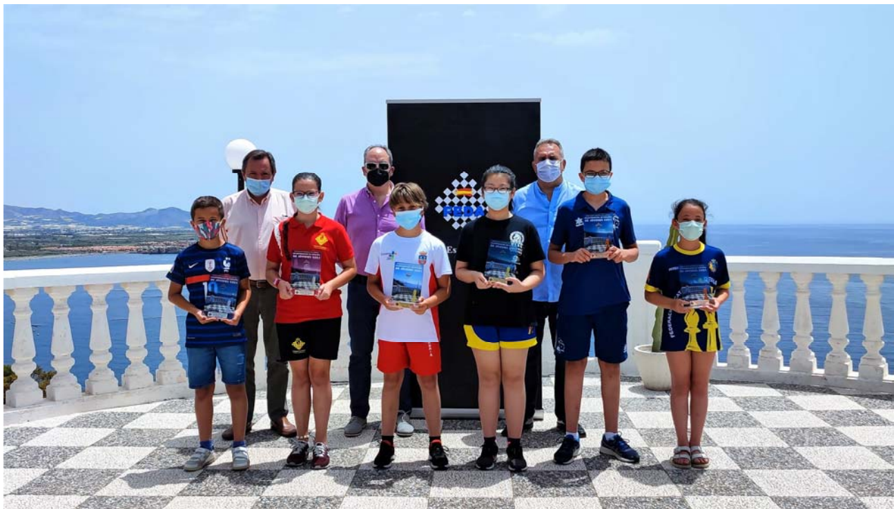
Podium Campeonato de España sub 12