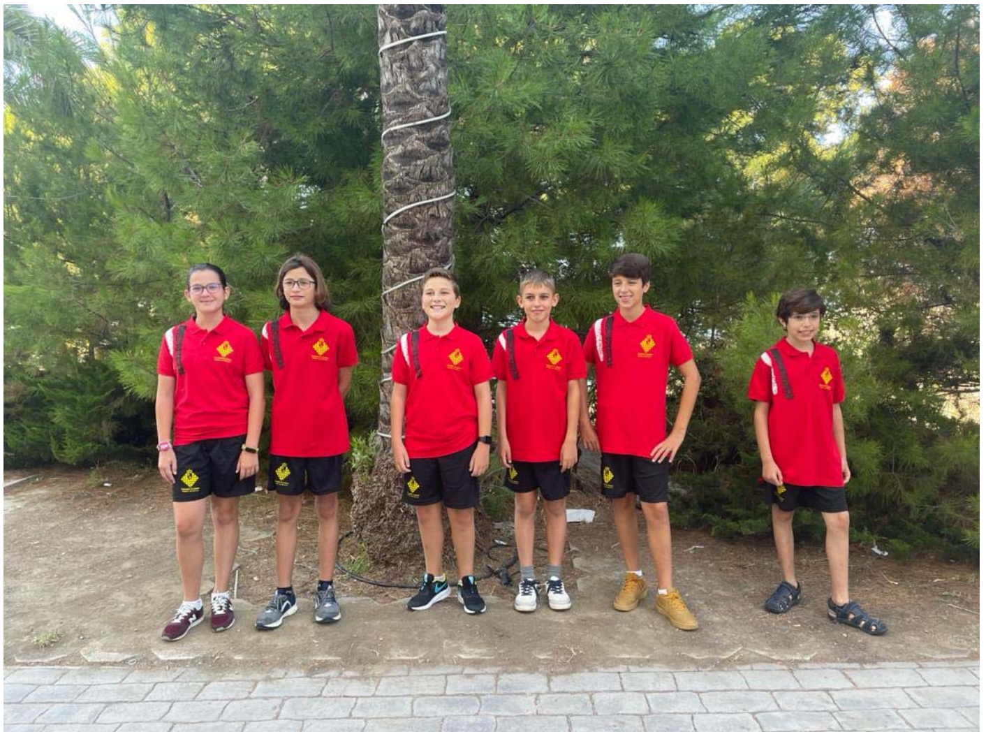
Participantes Federación Ajedrez Región de Murcia