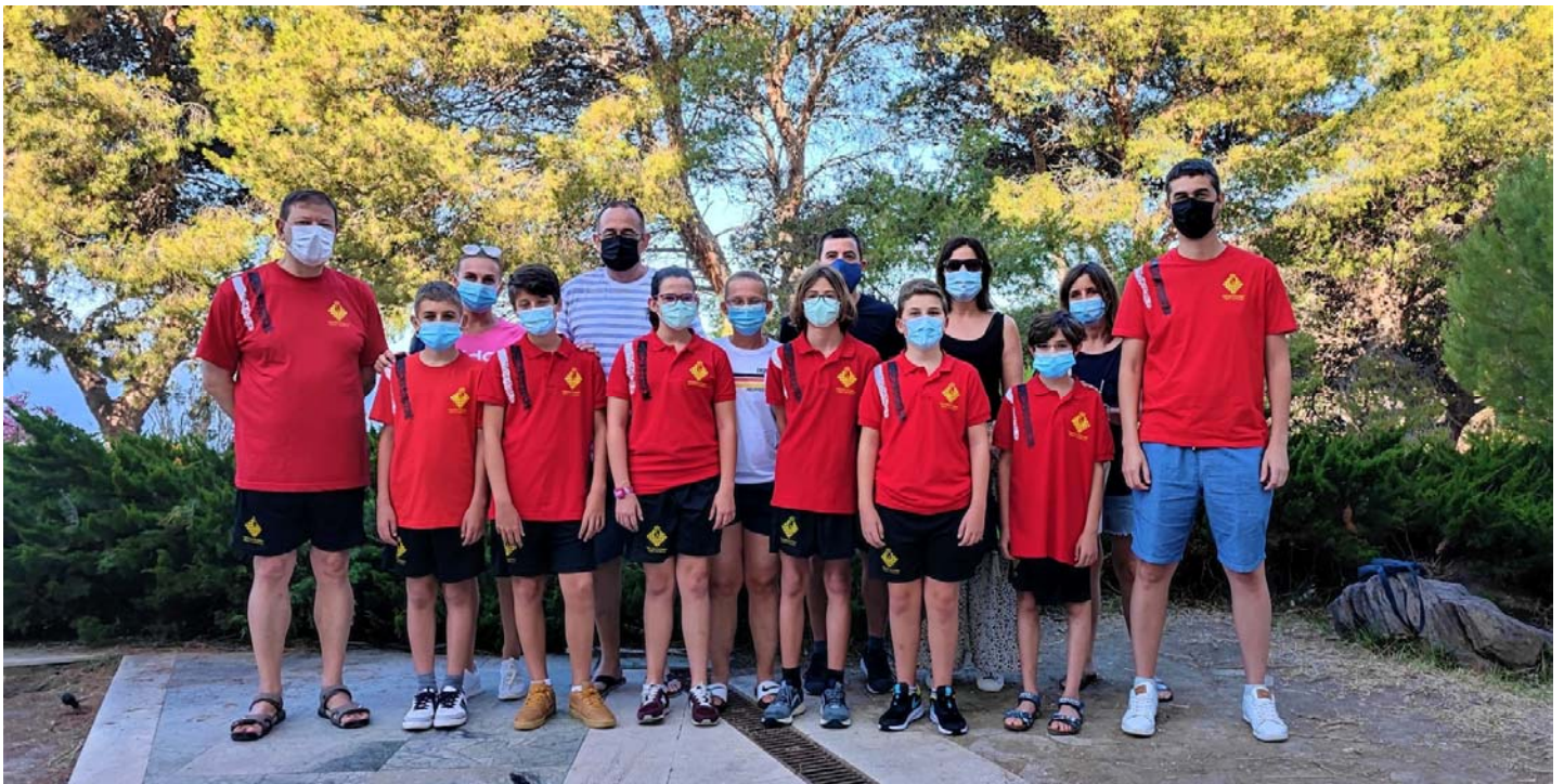
Jugadores, delegados y familiares