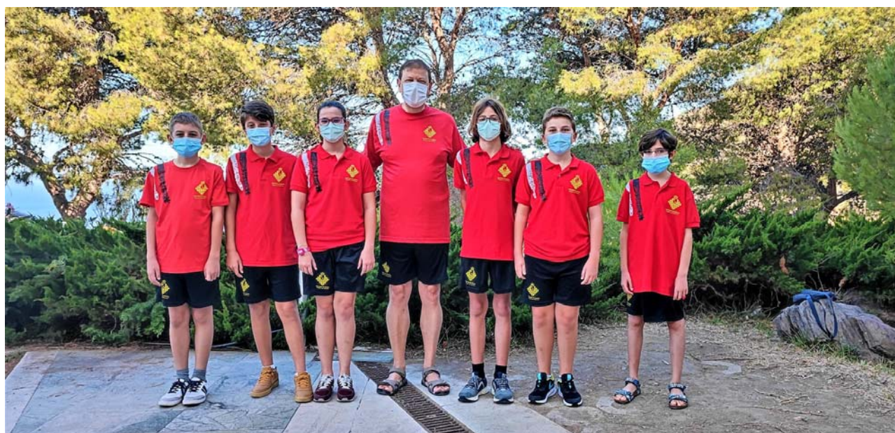
Participantes y delegado Región de Murcia