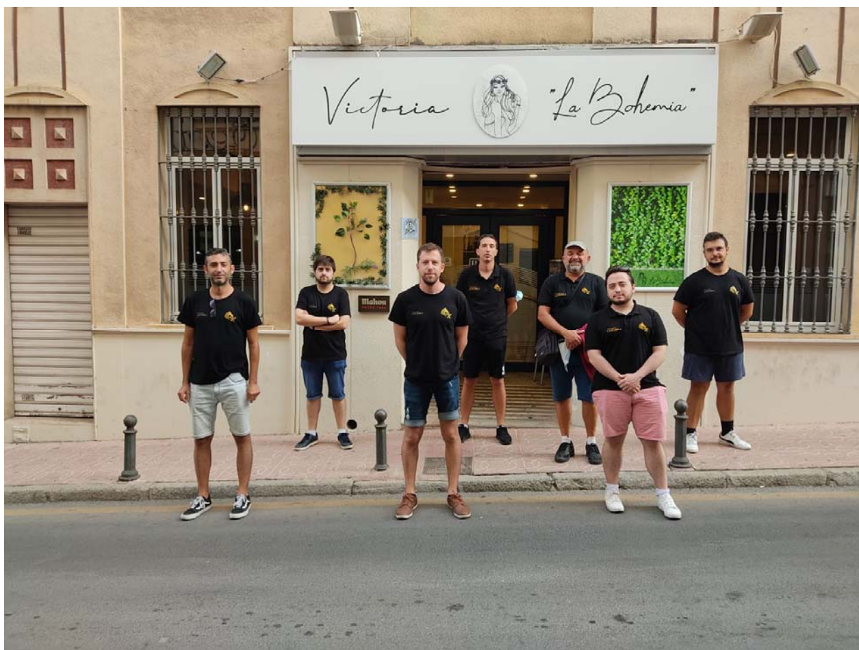
A.D Coimbra Jumilla

C/. Alfonso XIII, 101-LOS DOLORES 30310- CARTAGENA (Murcia) Tel/Fax. 968 12 61 62 www.farm.es e-mail: farm@farm.es