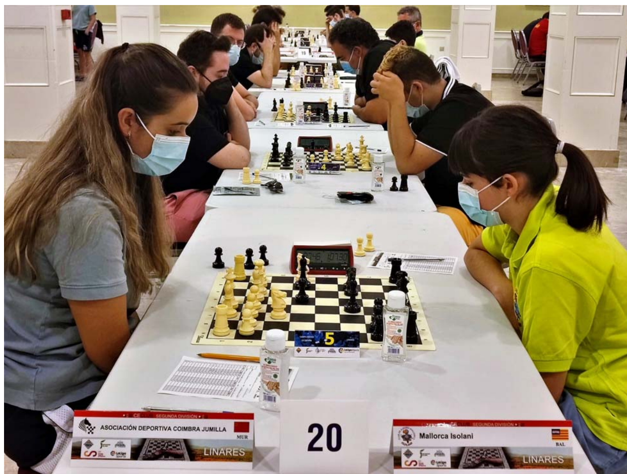
A.D Coimbra Jumilla