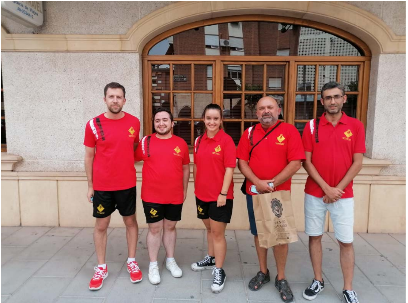
A.D Coimbra Jumilla

C/. Alfonso XIII, 101-LOS DOLORES 30310- CARTAGENA (Murcia) Tel/Fax. 968 12 61 62 www.farm.es e-mail: farm@farm.es