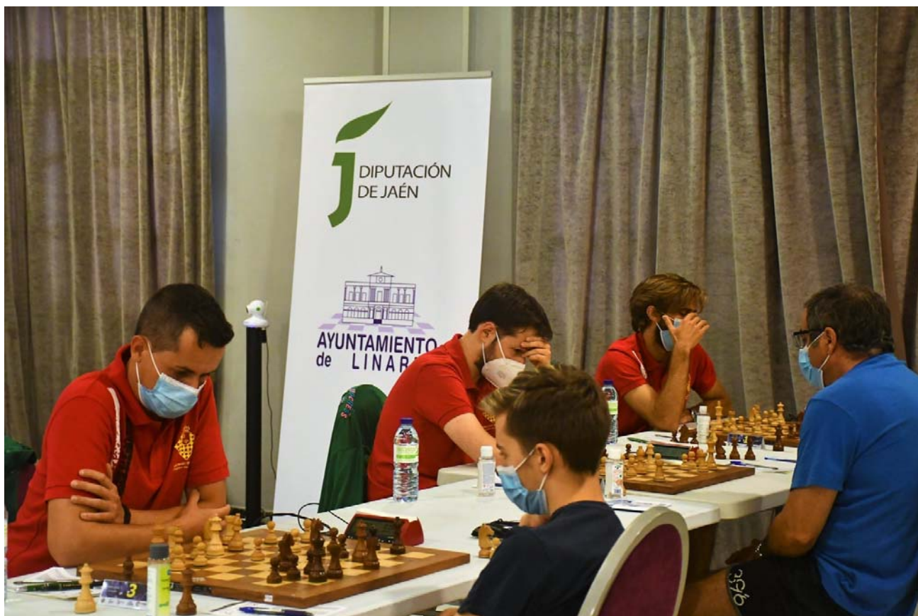
C.A.C. Beniaján Duochess "B"