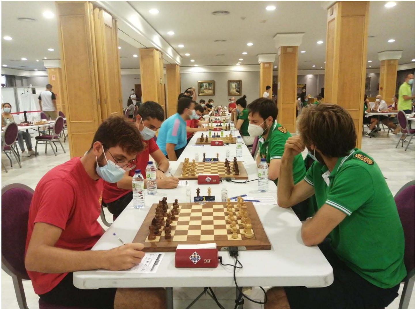
Sala de juego del Campeonato

C.A.C. Beniaján Duchess "B" por 9º clasificado Camp. España Equipos 2ª div.