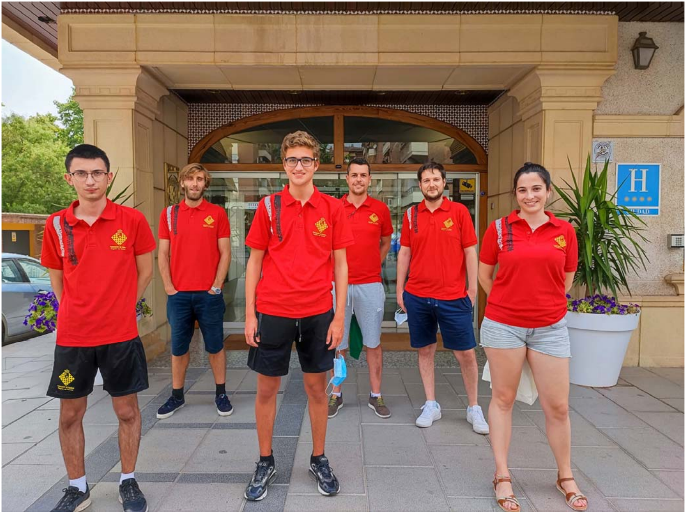
C.A.C Beniaján Duochess "B":

C/. Alfonso XIII, 101-LOS DOLORES 30310- CARTAGENA (Murcia) Tel/Fax. 968 12 61 62 www.farm.es e-mail: farm@farm.es