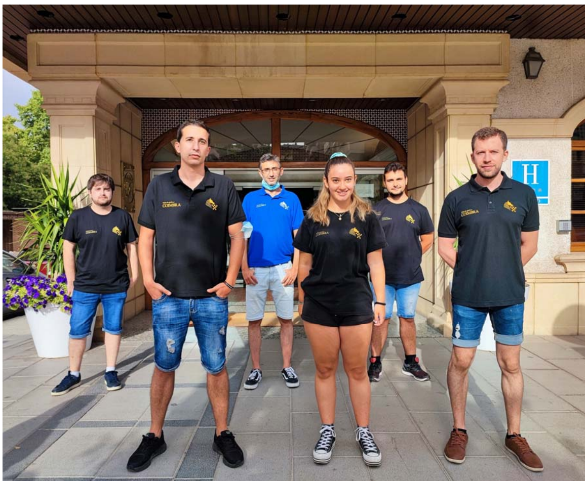
A.D Coimbra Jumilla