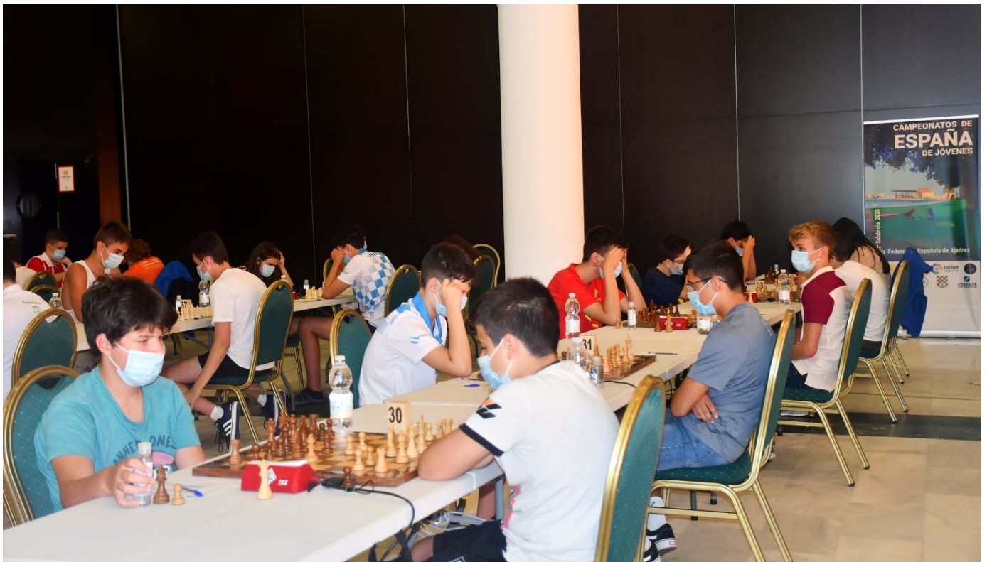
Sala de juego

Federación Española de Ajedrez - Federación Iberoamericana de Ajedrez - Coslada 10-4. 28028 Madrid - contacto@info64.org