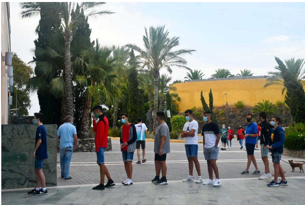
Entrando a la sala de juego