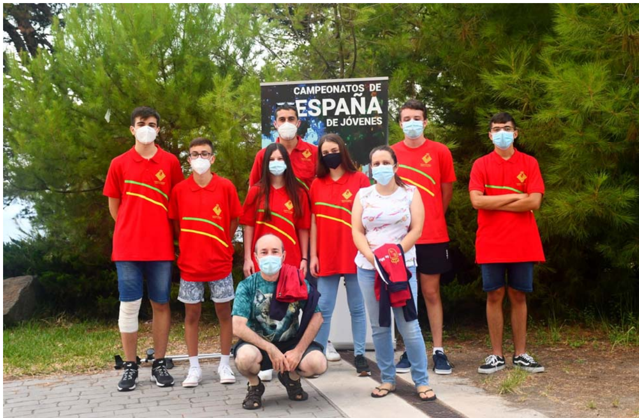
Expedición F.A.R.M y algunos familiares