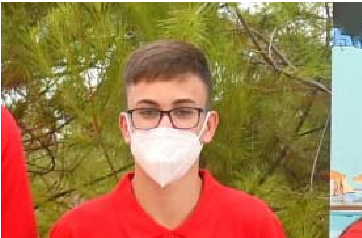
Miguel Jiménez García

C/. Alfonso XIII, 101-LOS DOLORES 30310- CARTAGENA (Murcia) Tel/Fax. 968 12 61 62 www.farm.es e-mail: farm@farm.es