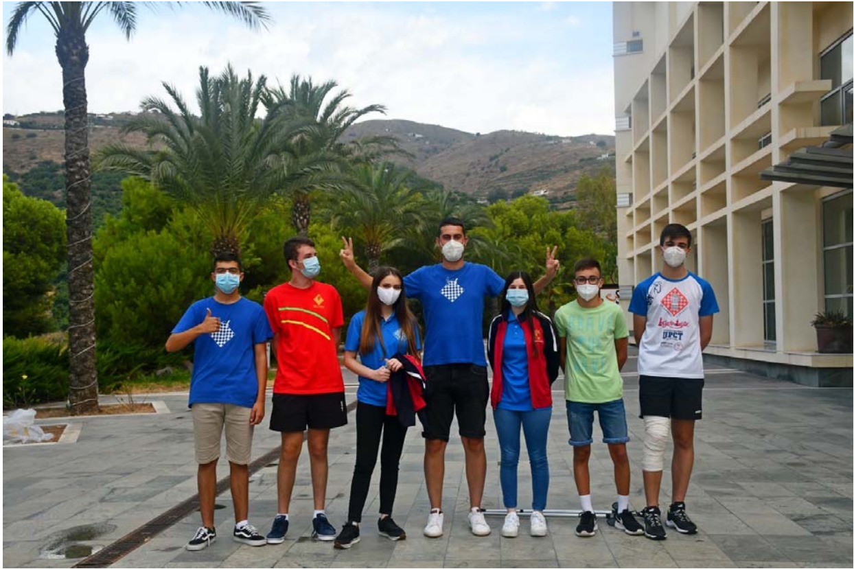
Participantes sub 16

C/. Alfonso XIII, 101-LOS DOLORES 30310- CARTAGENA (Murcia) Tel/Fax. 968 12 61 62 www.farm.es e-mail: farm@farm.es