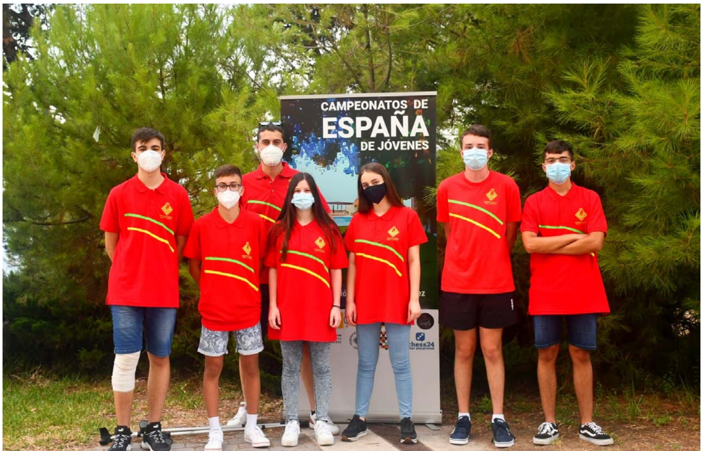
Participantes Federación Ajedrez Región de Murcia

Expedición Federación Ajedrez Región de Murcia