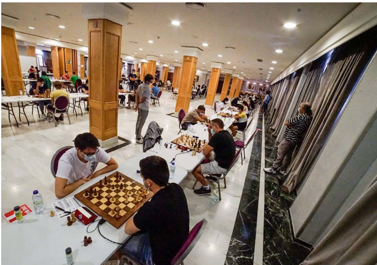
Sala de juego Hotel Aníbal