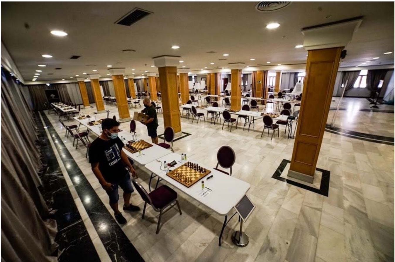
Sala de juego del Campeonato

C.A.C. Beniaján Duchess "B" por 7º clasificado Camp. España Equipos 2ª div.