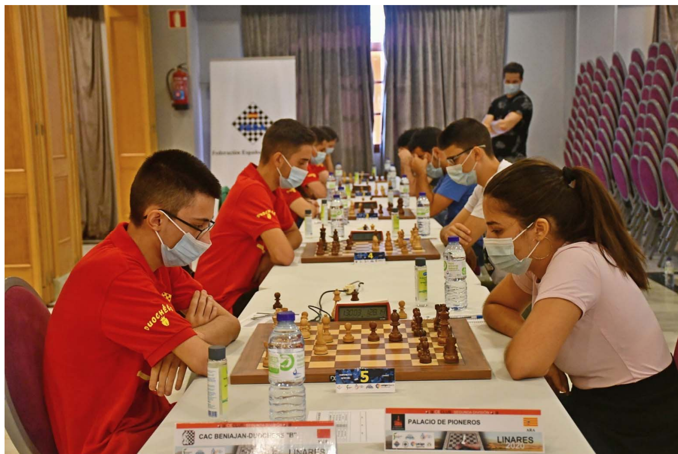
C.A.C. Beniaján Duochess "B"