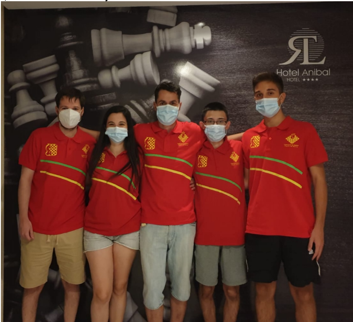
C.A.C Beniaján DuoChess "B":