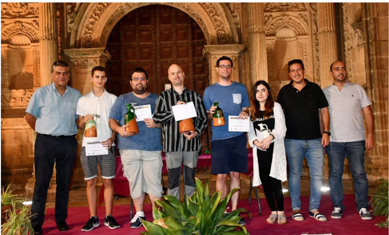
Premiados y autoridades