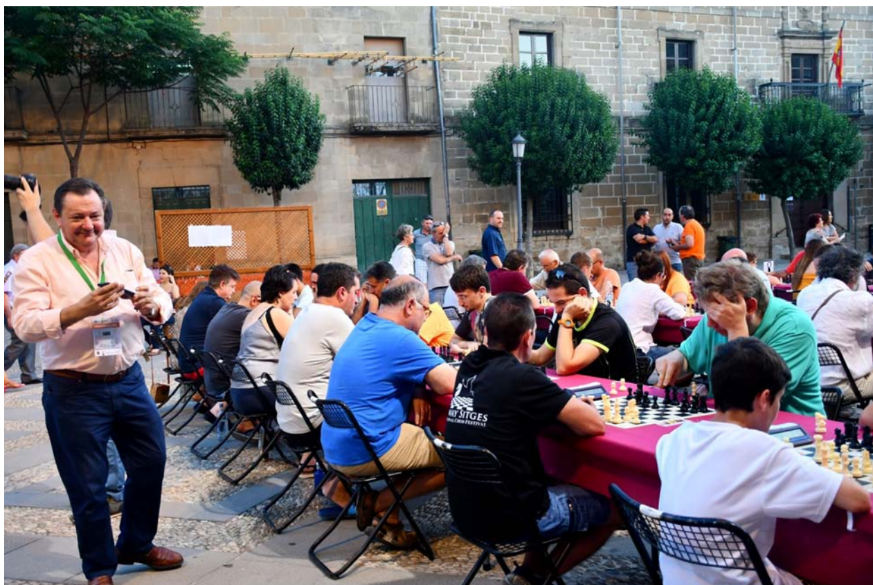
Partidas en la calle