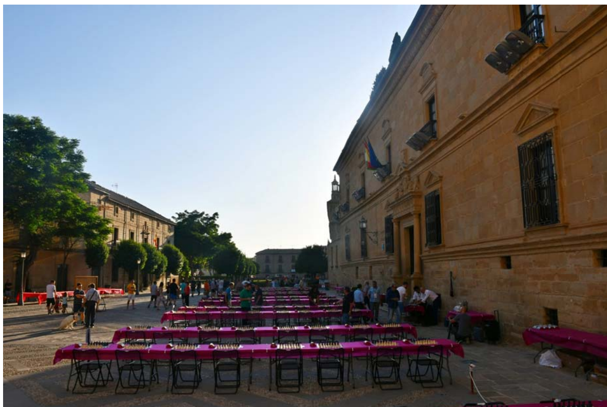
Plaza Vázquez de Molina (Úbeda) - Lugar de juego