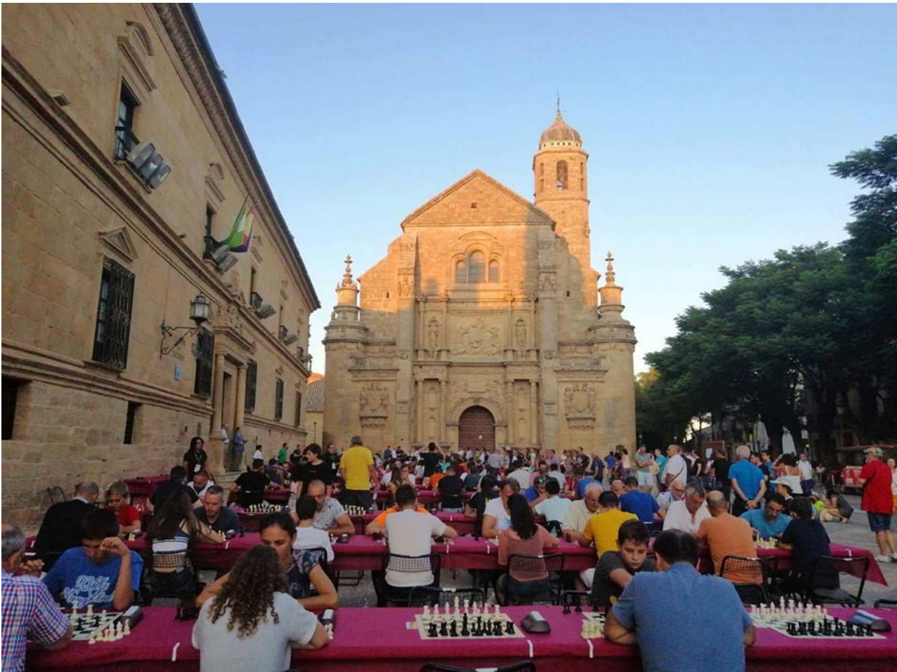
Plaza Vázquez de Molina (Úbeda) - Lugar de juego

El campeonato en esta categoría se ha disputado en 9 rondas de 3 minutos por jugador para toda la partida más 2 segundos de incremento por movimiento.