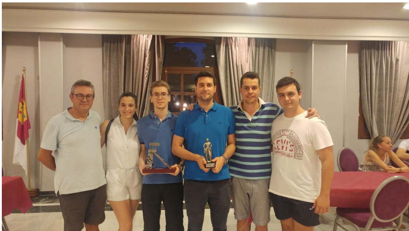
Amigos Federación de Ajedrez Región de Murcia