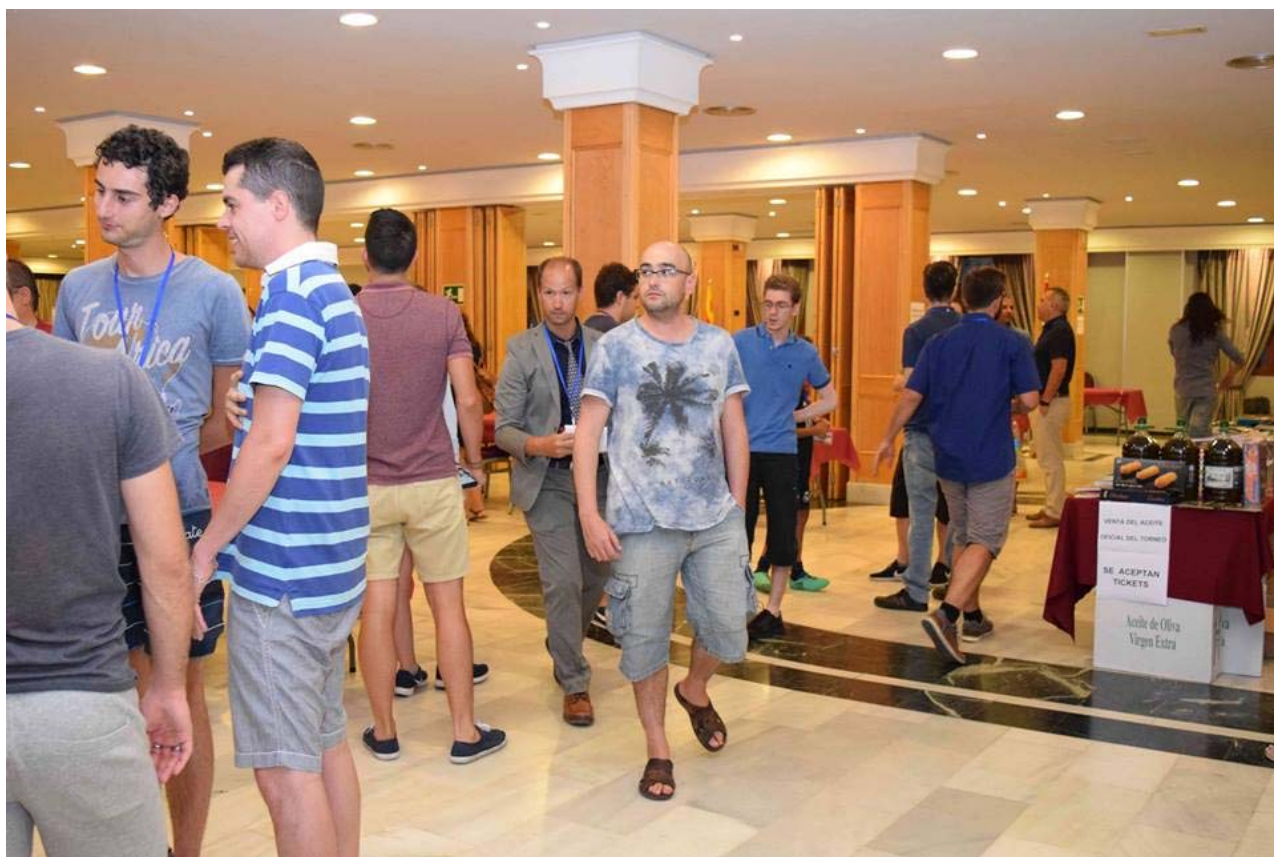
Exterior de la sala de juego

Federación Española de Ajedrez - Federación Iberoamericana de Ajedrez - Coslada 10-4. 28028 Madrid - contacto@info64.org