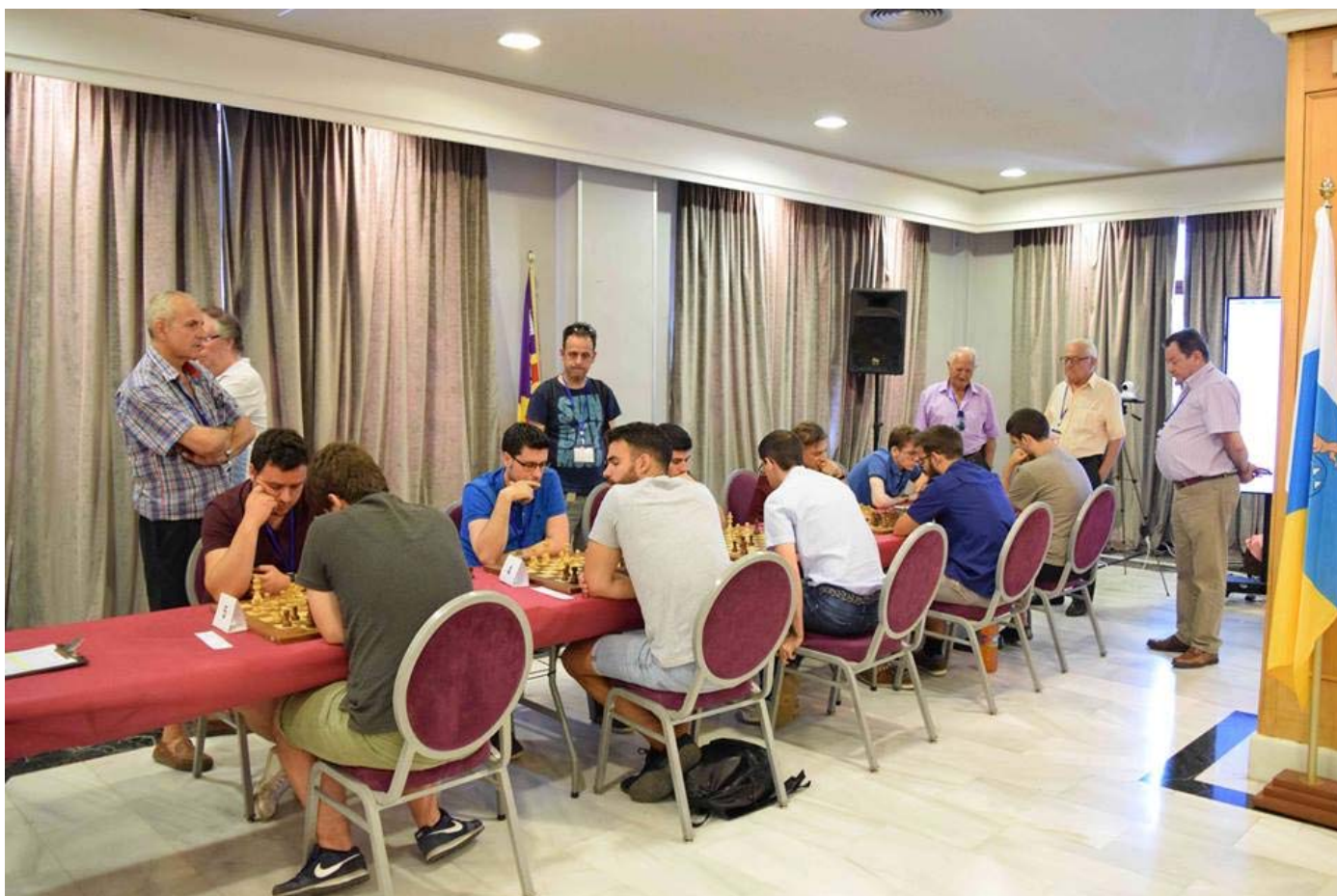
Sala de juego

GM José Carlos Ibarra Jerez. Subcampeón de España de Ajedrez Rápido