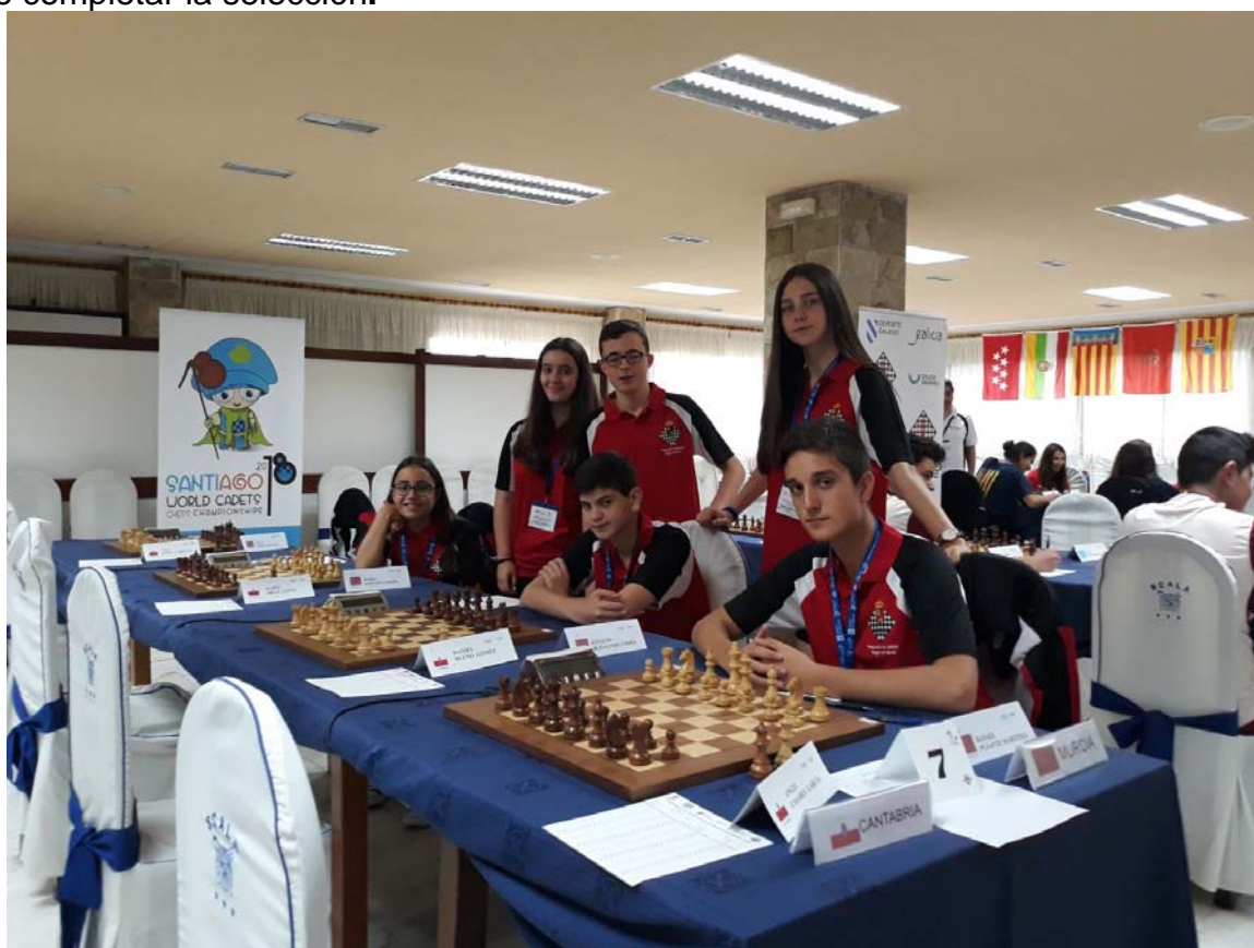
Selección Cadete Región de Murcia

Excelente Campeonato y organización. El equipo cadete estuvo formado por el primer y primera jugadora del Campeonato por Edades sub 16 y por los 2 primeros y 2 primeras jugadoras del Campeonato Regional de Selecciones Autonómicas de nuestra Comunidad, celebrado en Sangonera la Seca el pasado mes de Abril, con el objetivo de completar la selección.