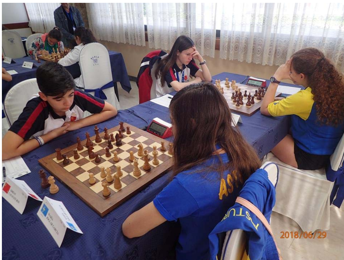
En la partida