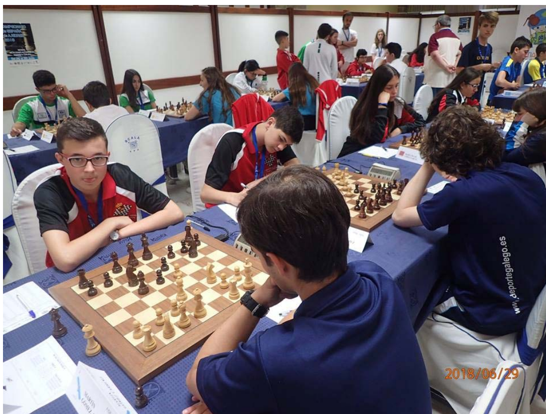
Selección Región de Murcia sub 16