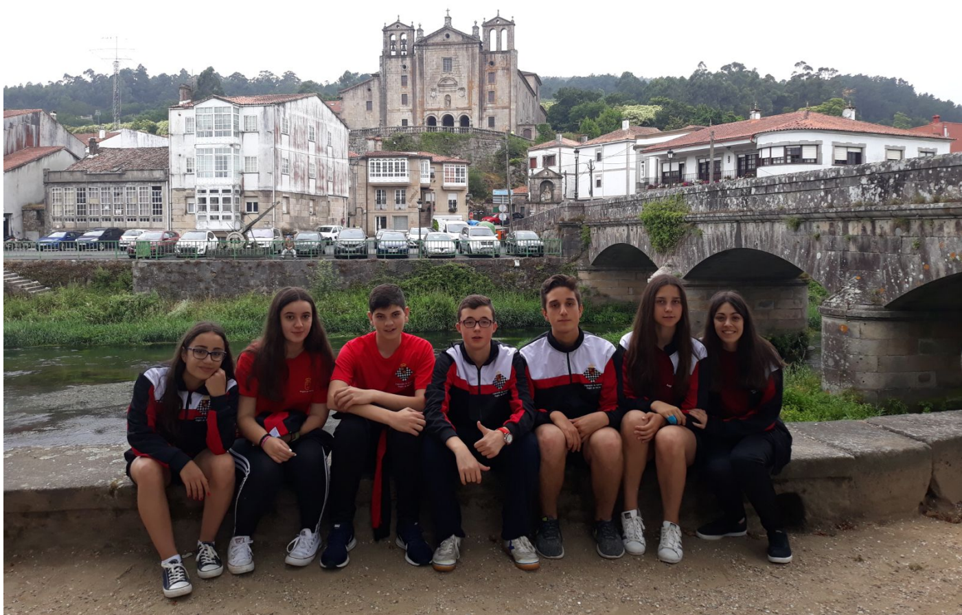
Selección Cadete de la Región de Murcia

C/. Alfonso XIII, 101-LOS DOLORES 30310- CARTAGENA (Murcia) Tel/Fax. 968 12 61 62 www.farm.es e-mail: farm@farm.es