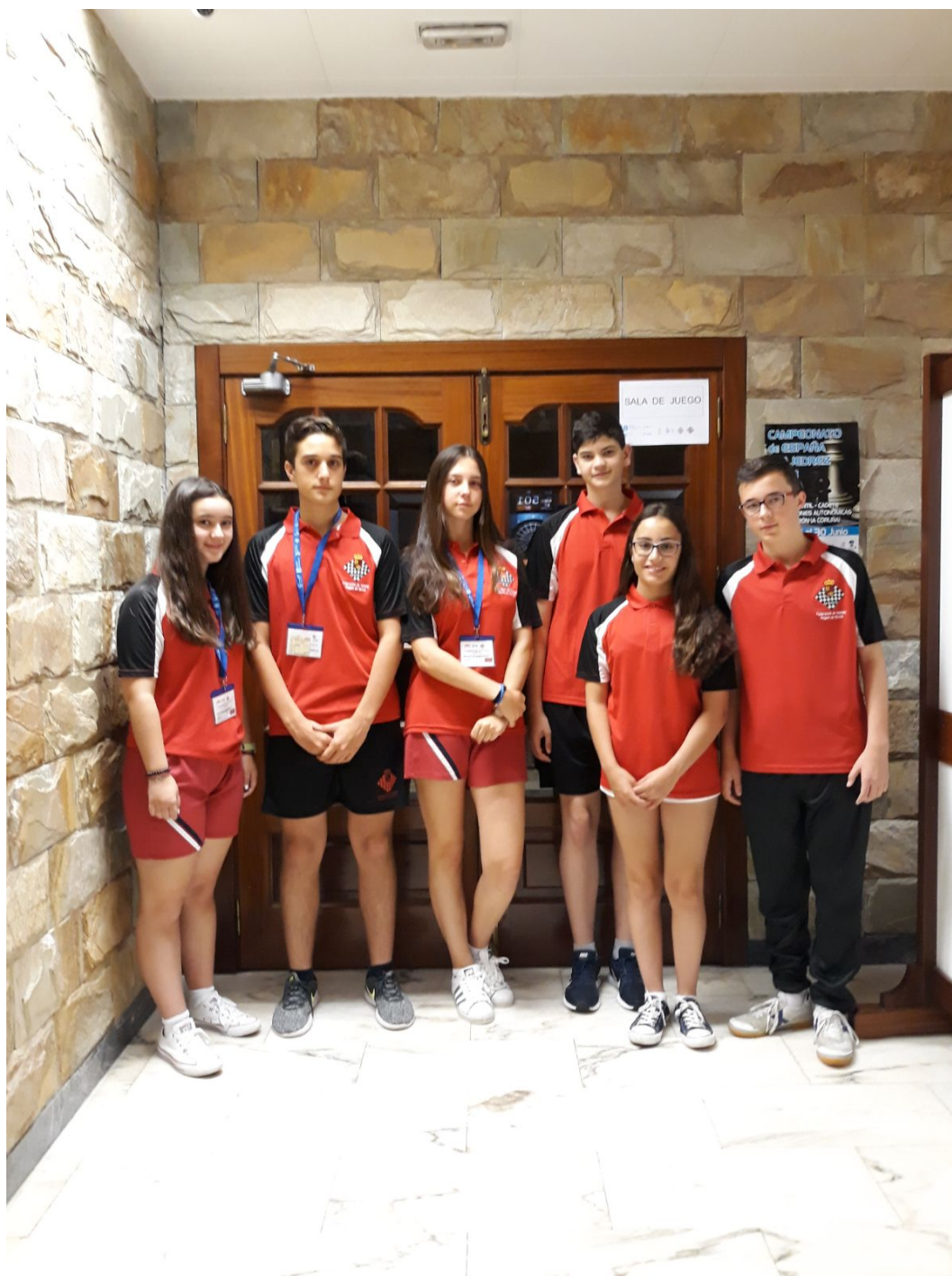
Selección Cadete de la Región de Murcia

C/. Alfonso XIII, 101-LOS DOLORES 30310- CARTAGENA (Murcia) Tel/Fax. 968 12 61 62 www.farm.es e-mail: farm@farm.es