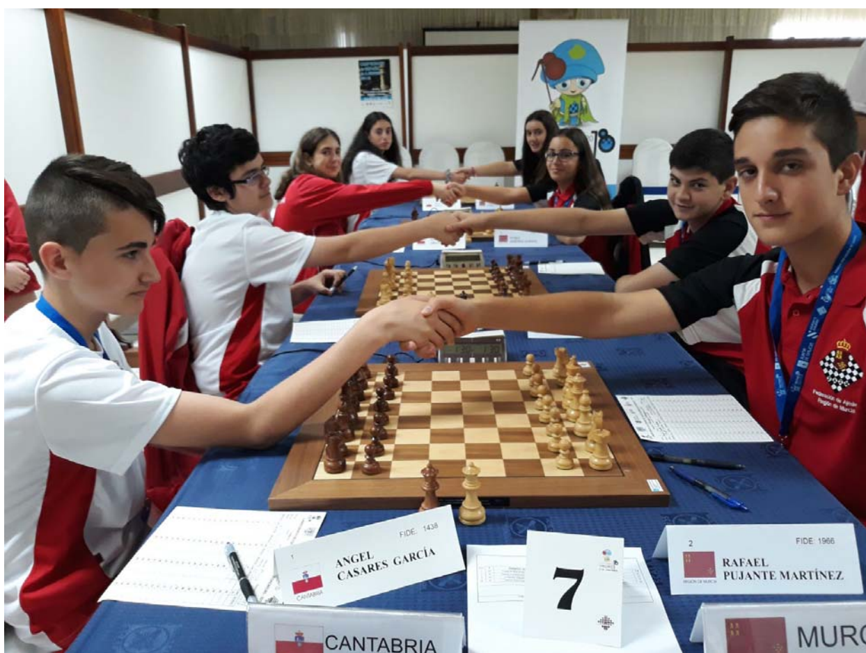
Selección Cadete Región de Murcia