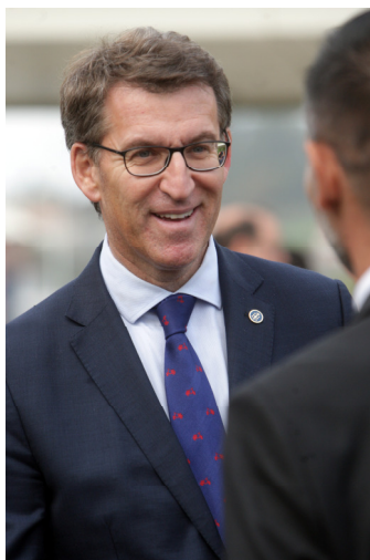
Alberto Núñez Feijoo - Presidente de la Xunta de Galicia