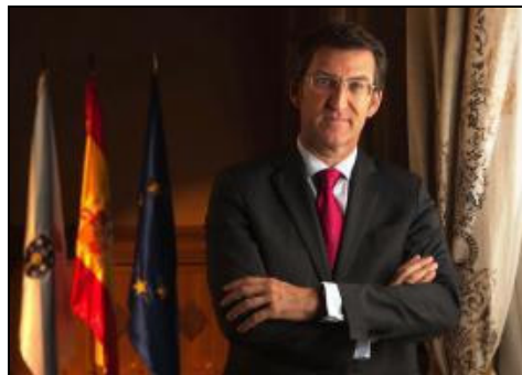
D. Alberto Núñez Feijóo PRESIDENTE DE LA XUNTA DE GALICIA

Finalmente, no quiero dejar pasar esta oportunidad para agradecer a la organización del campeonato, federaciones implicadas, voluntarios y demás personal de apoyo, el tiempo dedicado a la preparación de este campeonato y sin el cual habría sido imposible su celebración.