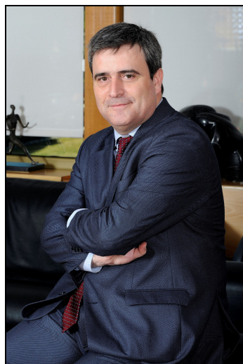
Miguel Cardenal Carro Presidente del Consejo Superior de Deportes

Aproximadamente un centenar de ajedrecistas, en representación de sus Comunidades Autónomas, se darán cita en este evento deportivo y nos mostrarán su técnica en el tablero y sus estrategias en el movimiento de las fichas, elementos que hacen tan especial a este deporte. Enhorabuena a todos ellos por llegar hasta esta fase final. Espero que disfruten intensamente de este deporte y del entorno geográfico dónde se va a desarrollar.