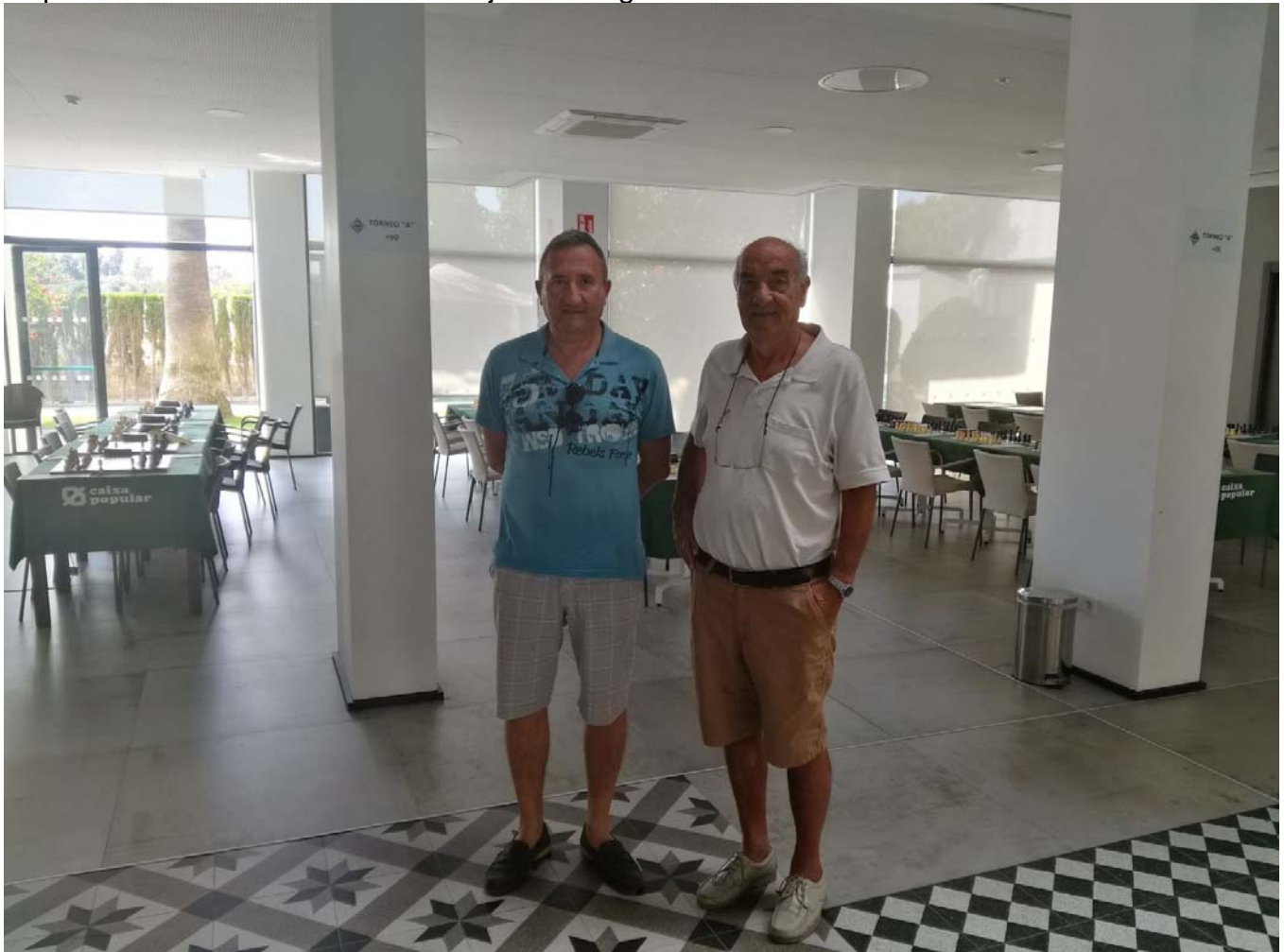
Representantes de la F.A.R.M

Representantes de la Federación Ajedrez Región de Murcia: